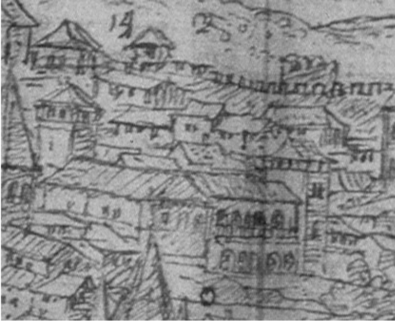
Figura 1. Anton van den Wyngaerde. Vista de Zamora. Palacio de los condes de Alba de Aliste con la torre fuerte.