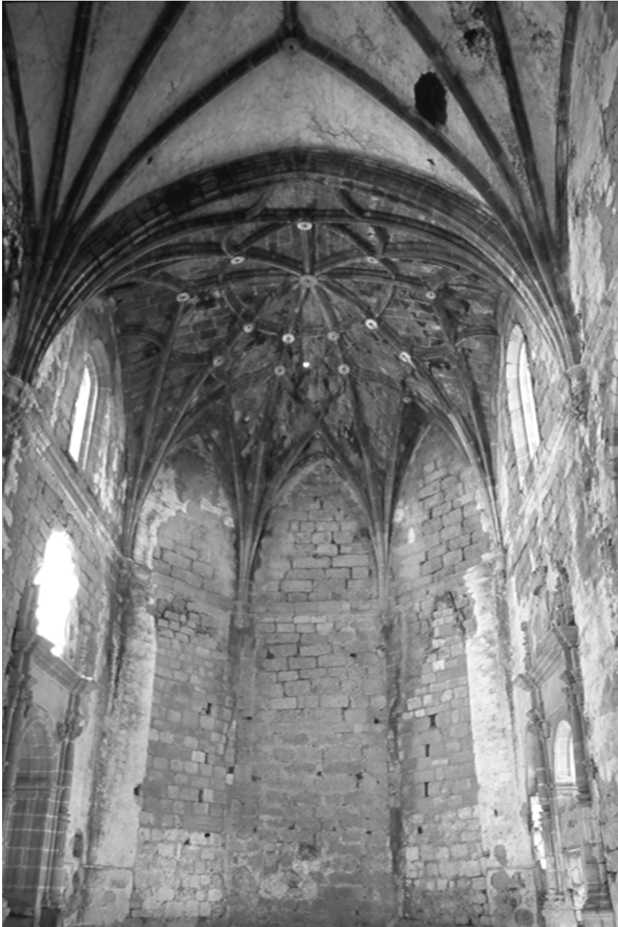
Figura 9. Convento de San Antonio de Garrovillas. Interior de la capilla mayor.