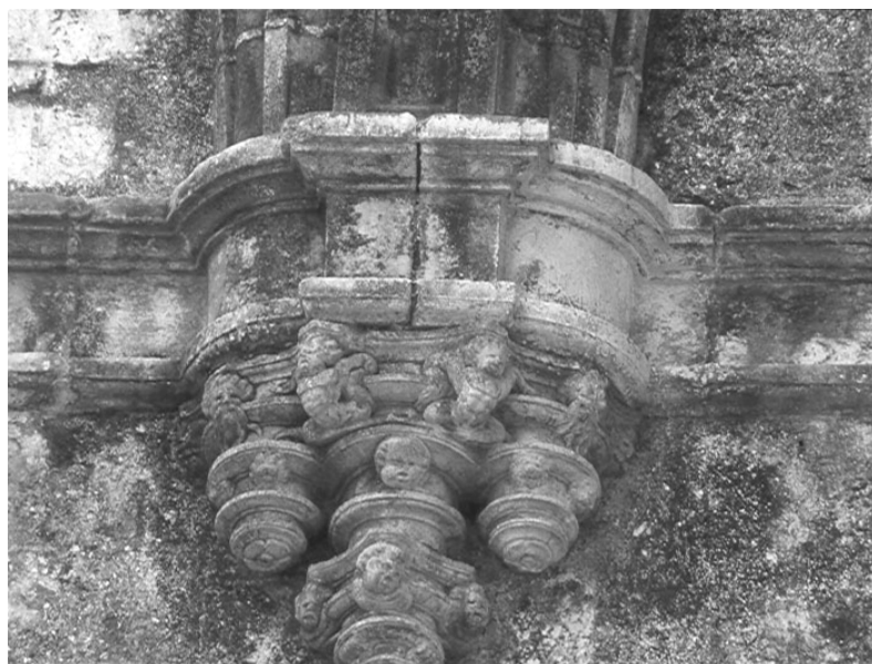
Figura 8. Convento de San Antonio de Garrovillas. Detalle de un responsión.