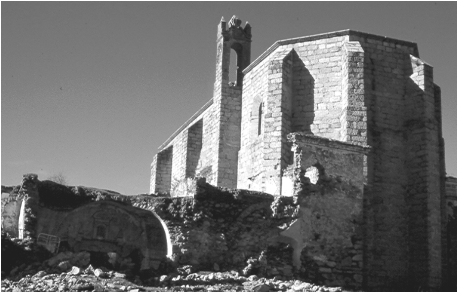
Figura 6. Convento de San Antonio de Garrovillas (Cáceres). Exterior.