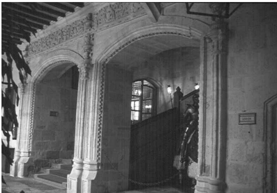
Figura 4. Palacio de los Condes de Alba de Aliste. Zamora. Boca de la escalera.