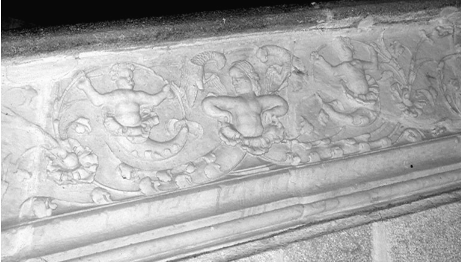
Figura 5. Palacio de los Condes de Alba de Aliste. Zamora. Escalera. Detalle.