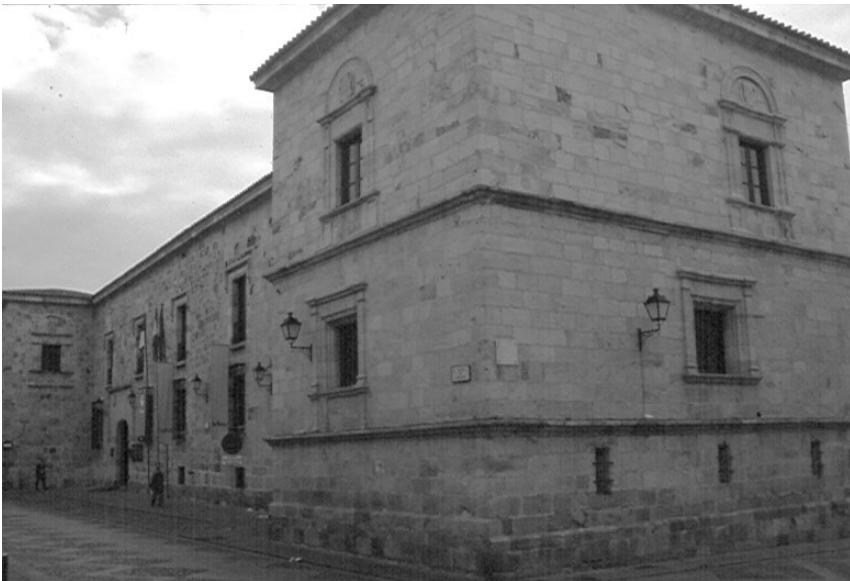
Figura 2. Palacio de los condes de Alba de Aliste. Zamora. La torre fuerte desmochada en primer término.