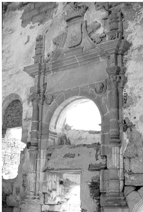
Figura 7. Convento de San Antonio de Garrovillas. Sepulchro de doña María de Guzmán, primera Condesa de Alba de Aliste.