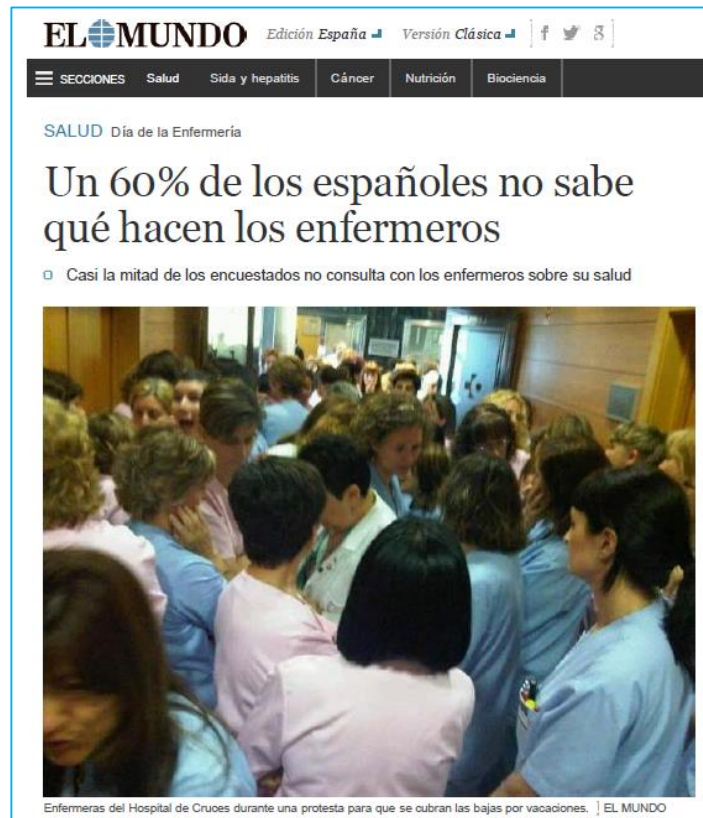
Figura1: Noticia publicada en el Mundo Digital. Disponible en:

En relación a revistas científicas, si existen artículos que aporten una identidad real de la práctica enfermera, firmados por los propios profesionales del colectivo, pero estas titulaciones son prácticamente desconocidas para la sociedad en general, por lo que no resultan influyentes.