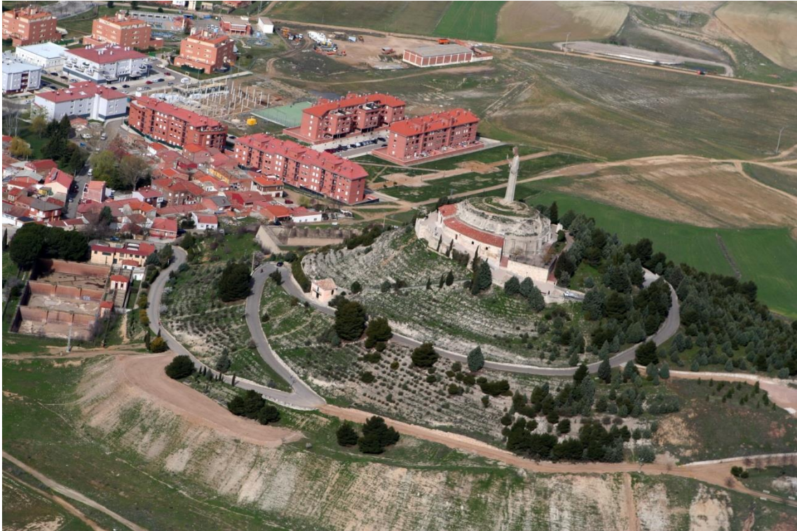
Fotografía tomada desde el aire del Cristo del Otero y alrededores.