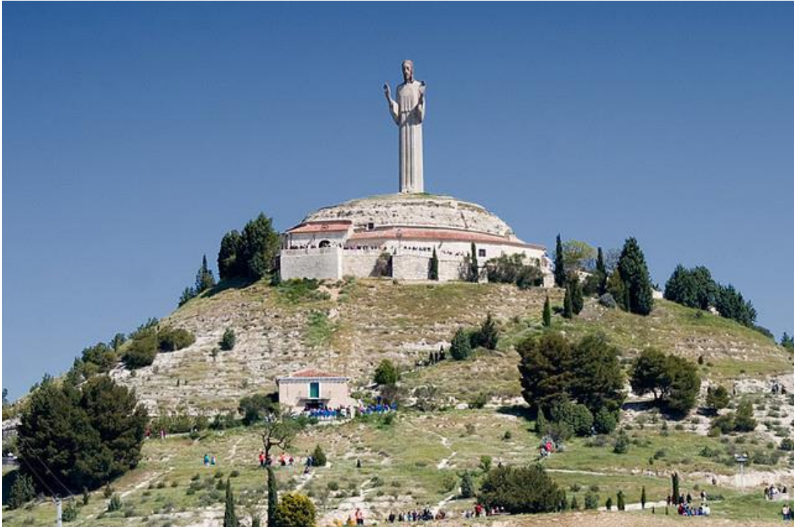
Fotografía del Cristo del Otero.