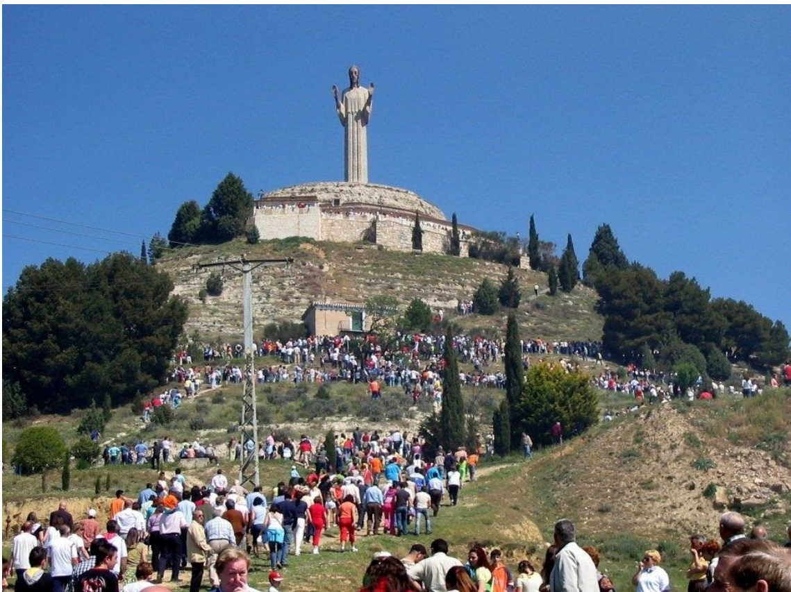
Fotografía de la Fiesta de Santo Toribio.