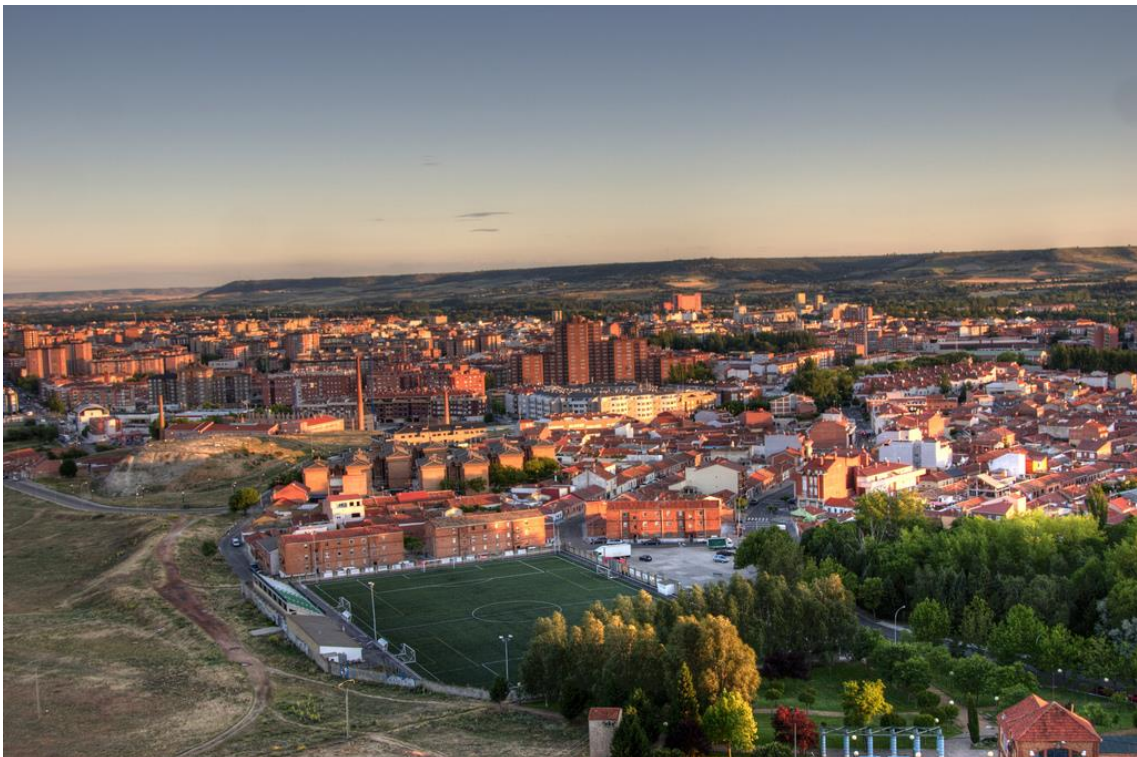
Panorámica desde lo alto del Cristo del Otero.