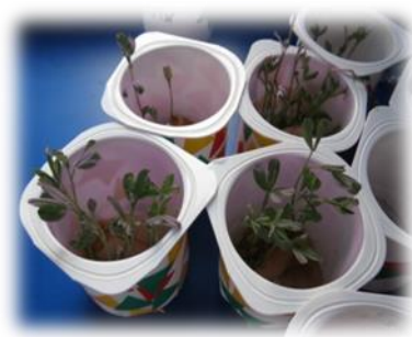
Fig. 7. Actividad: Y, a esperar a que germine la plantita.

Esta actividad, además de fomentar los valores de la responsabilidad y la autonomía, sirvió para trabajar la ecología y el amor a la naturaleza.