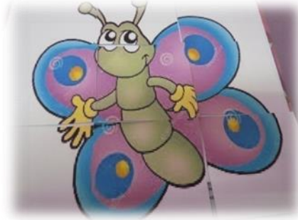
Fig.9. Actividad: Rompecabezas de la primavera.

Entregué al grupo de niños que estaba conmigo un sobre que contenía las partes del dibujo que entre todos tenían que formar con el fin de fomentar el trabajo en equipo, la cooperación.