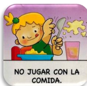
Figs. 2 y 3. Actividad: Aprendemos a comer en la mesa.