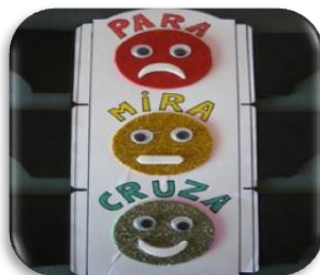
Fig. 10. Actividad: ¿Pasamos o no pasamos?

Con esta actividad y los cuentos logré hacerles ver lo importante que es el respeto y la obediencia a las señales de tráfico para nuestra seguridad vial.