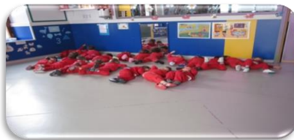
Fig. 6. Actividad: Jugamos a relajarnos.

El valor que pretendía fomentar era el de la autonomía.