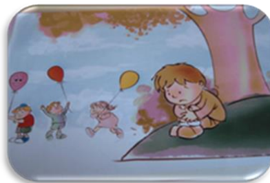
Fig. 12. Actividad: El globo feliz.