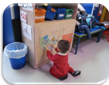
Fig. 1. Actividad: Cara contenta o triste.

“¿El helado podemos comerlo mucho?”. “Entonces, ¿va en la cara contenta o en la triste?”. Y, así con cada niño hasta que intervinieron todos.