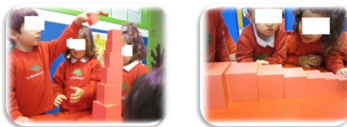
Figs. 4 y 5. Actividad: Jugamos a la Torre Rosa.

Este material, en realidad, se utiliza para el desarrollo de la discriminación visual de tamaño en tres dimensiones y prepara al niño para los conceptos matemáticos. Sin embargo, en esta ocasión, lo utilicé para fomentar el valor del orden, pidiendo a los niños que ordenaran los cubos de mayor a menor tamaño, ya fuera hacia arriba o hacia abajo.