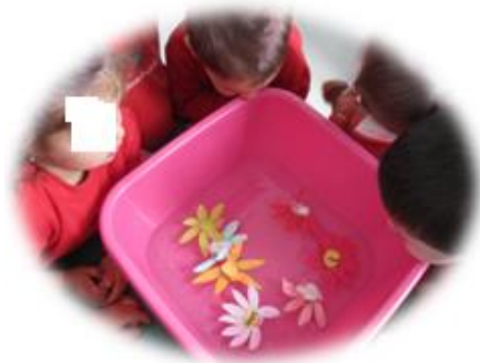
Fig. 8. Actividad: Las flores necesitan agua para

Consistía en doblar una flor de papel para que se cerrara totalmente y echarla al agua para que se abriera. (Cada flor tenía escrito el nombre de cada niño, para que se sintieran más motivados, ya que, a pesar de ser tan pequeños, ya saben cómo se escriben).