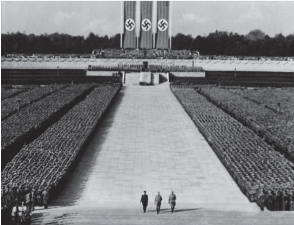
Escena en la que se puede observar el perfecto orden que guardan las tropas a la llegada de Hitler. 30