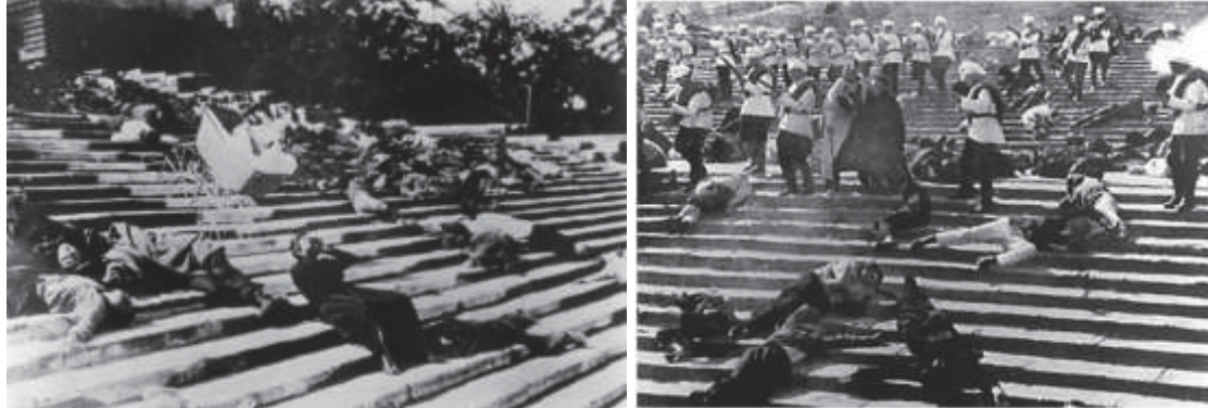
En la primera imagen se ve el coche de bebé cayendo escaleras abajo. En la segunda imagen, la verdadera lucha, con la gente escapando del lugar mientras son acribillados. 18

las obras históricas del cine, ha sido homenajeada y repetida en diversos medios 17 . A pesar de ello, lejos de homenajes y repeticiones, su valor artístico no ha podido ser igualado, y ese es precisamente uno de los triunfos de Eisenstein.