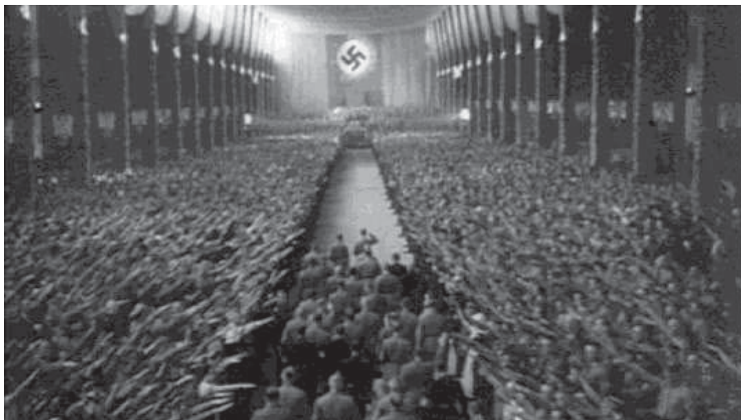
Hitler, en su llegada a la sede del partido, es recibido entre vítores como un Dios. 27

El Partido Nazi llegaba a su segundo año en el poder en Alemania y Hitler vio en este evento una ocasión sinigual para transmitir su visión de la nación y que quería que el resto tuvieran. Por ello, lo primero que debía tratar era su propia imagen. El documental parte de una serie de ideas o conceptos que va desarrollando, siempre en busca de su objetivo principal, que es presentar a Hitler como un Dios, que llega desde las alturas, y baja a la tierra para encontrarse con el resto de los 'mortales'.