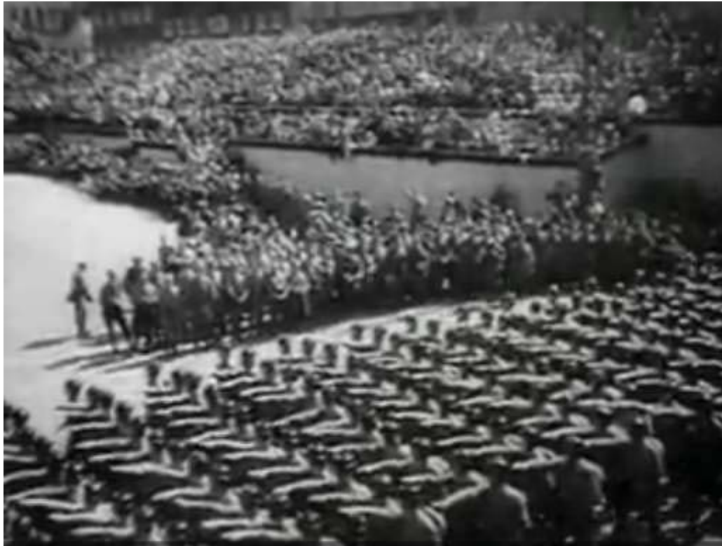
Desfile de tropas que caminan con el saludo hacia Hitler. 31