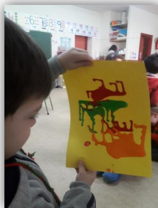
Imagen 1. Actividad laberintos de colores.

Referencias bibliográficas: Planificación y elaboración propia.