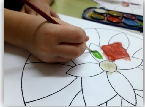
Imagen 4. Mandala en acuarela.

Previamente a la actividad, la maestra ha creado un mandala y se ha fotocopiado para cada uno de ellos en A4. Antes de comenzar la actividad se pregunta y se explica qué es un mandala. Se muestran los materiales que van a ser utilizados, en este caso acuarelas y pinceles. Se dará la única pauta de pintar cada apartado de un color, la elección es libre. Y al finalizar cada uno será responsable de la limpieza del lugar de trabajo.