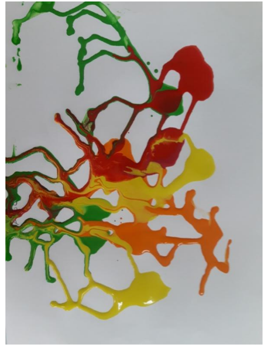
Actividad: Laberintos de colores.