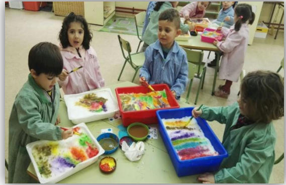
Actividad: Pintamos la nieve.