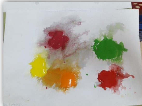
Actividad: Pintamos sopando.