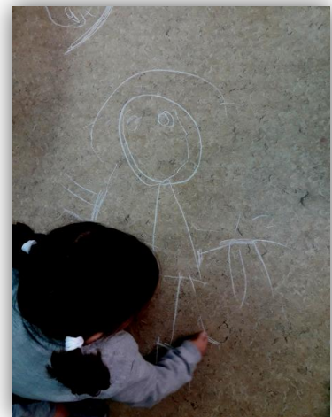
Imagen 6. Autorretrato con tiza.

Referencias bibliográficas: Planificación y elaboración propia.