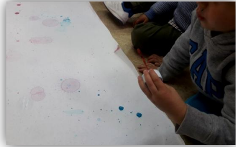
Imagen 2. Actividad Pompas de colores.