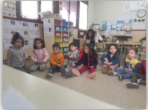
Imagen 7. Me inventaré.

En anexos IV: código QR con acceso directo a un vídeo resumen de la realización de la propuesta de intervención.