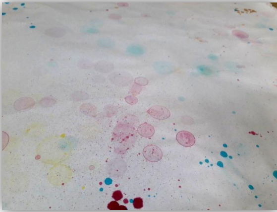
Actividad: Pompas de colores.