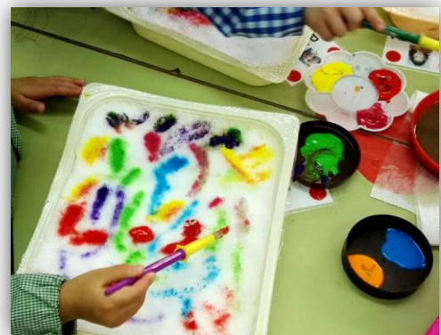
Imagen 5. Pintamos la nieve.

Previamente la maestra cogerá en distintos recipientes nieve. Con pinceles y pintura irán creando sus dibujos de forma libre en la nieve que se les ha proporcionado. Podrán apreciar los cambios que sufren tanto la nieve como la