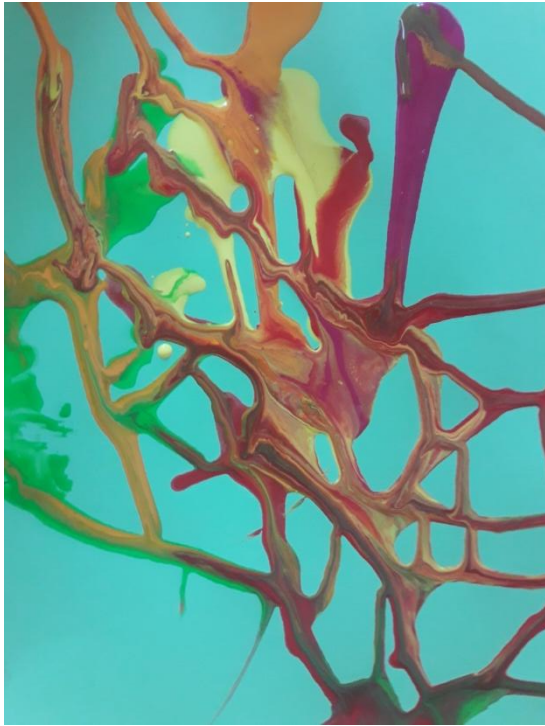
Actividad: Laberintos de colores.