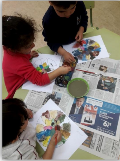
Actividad: Mandala en acuarela.