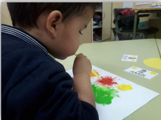
Actividad: Pintamos sopando.