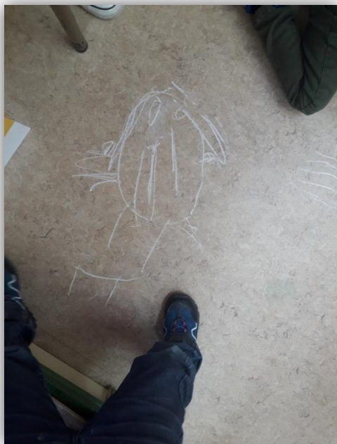
Actividad: Autorretrato con tiza.