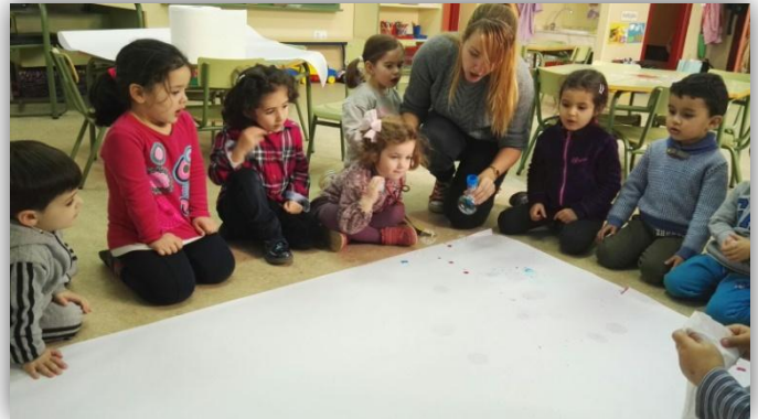
Actividad: Pompas de colores.