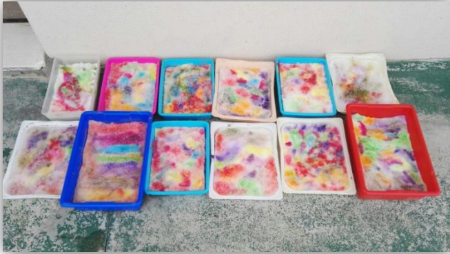
Actividad: Pintamos la nieve.