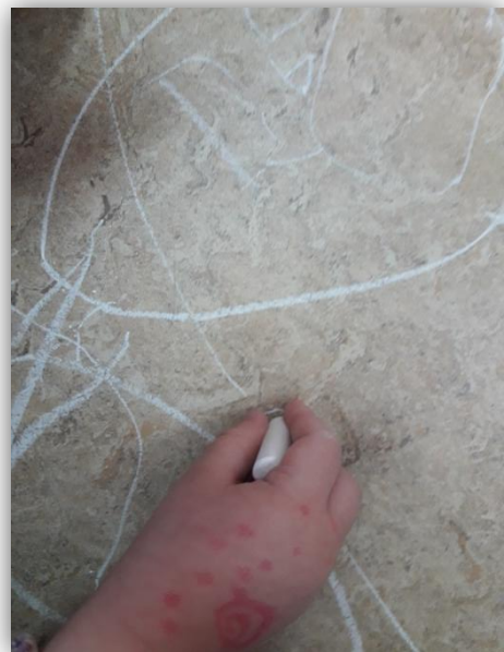
Actividad: Autorretrato con tiza.