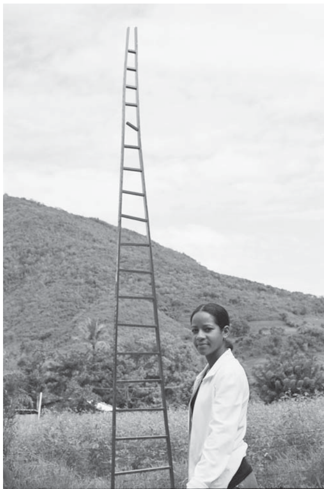
Foto 3. “Espacio para un sueño” -detalle- (2000) Autor: Ricardo Calero