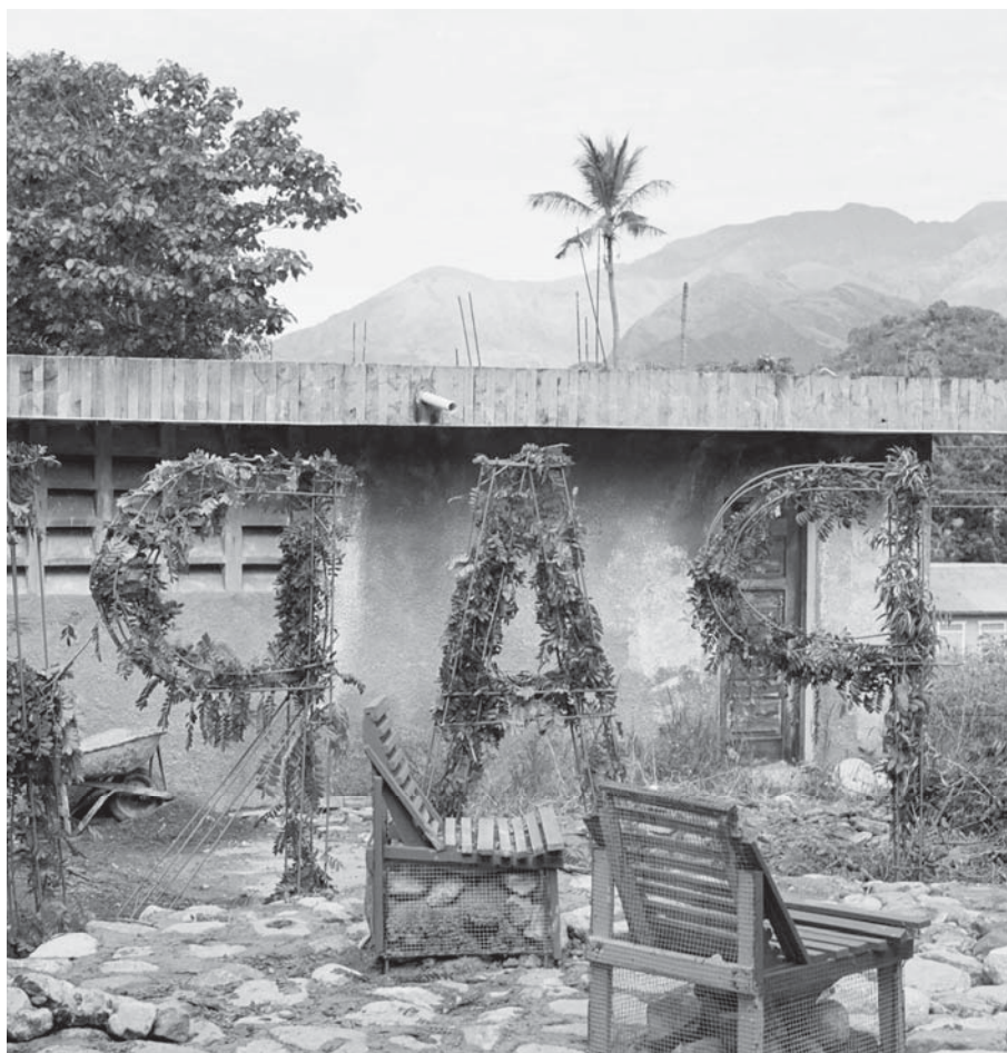
Foto 5. “Espacio para un sueño” -detalle- (2000) Autor: Ricardo Calero