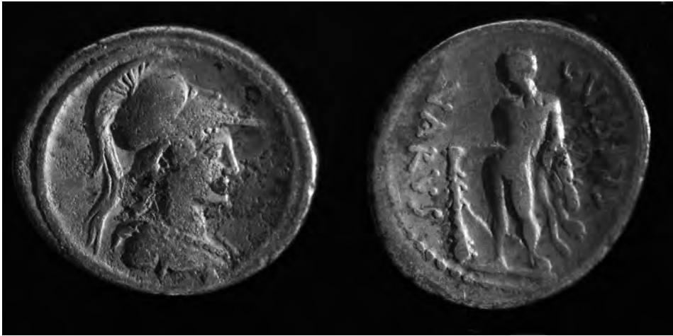
Fig. 8. Denario de C. Vibius Varus (cat. RAH: nº 1051) procedente del tesoro de Uxama (módulo de la pieza: 18,5 mm.).

hecho de que los fondos del Gabinete Numario de esta época se encuentren aún en proceso de catalogación impide de momento su posible identificación con las piezas conservadas hoy en día. En cualquier caso, sí pueden esbozarse algunos planteamientos generales en cuanto a emperadores representados, denominaciones, etc.