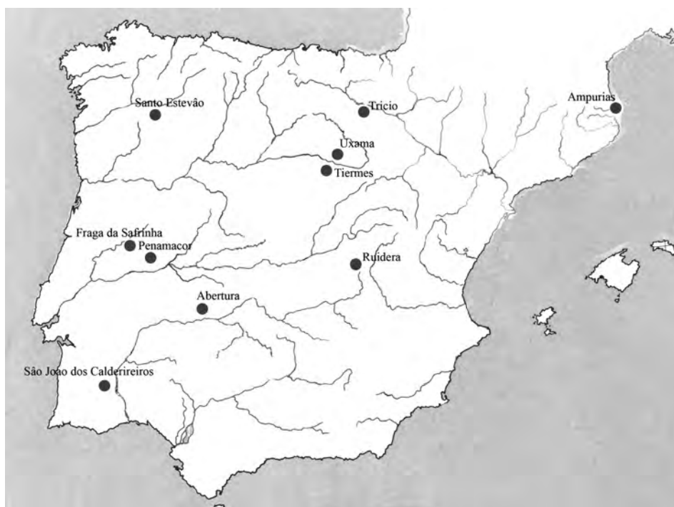
Fig. 6. Tesoros peninsulares de cronología augustea anteriores al 2 a.C.

desde finales del s. II hasta las emisiones augusteas acuñadas en Hispania alrededor del 19-18 a.C. Del tesoro de Penamacor, descubierto en 1948, se han publicado dos lotes de monedas, el primero formado por 10 denarios (Ramires, 1952) y el segundo por 76 (Guedes, 1955) aunque cabe la duda de que en este segundo figuren piezas del primero (Volk, 1997: 173, n° 51). Las monedas más modernas son augusteas fechadas entre los años 15-13 a.C. (RIC I 2 167 a, 171a y 173 a). Finalmente, el tesoro de S. João dos Caldeireiros tiene una fecha de cierre algo anterior, pues la moneda más moderna parece ser un denario de Emerita de c. 23 a.C. (Centeno, 1987: 212, n° 26; Volk, 1997: 171, n° 42). El resto de los 126 ejemplares estudiados, de los cerca de mil que fueron encontrados en 1958, se fehan desde mediados del siglo II.