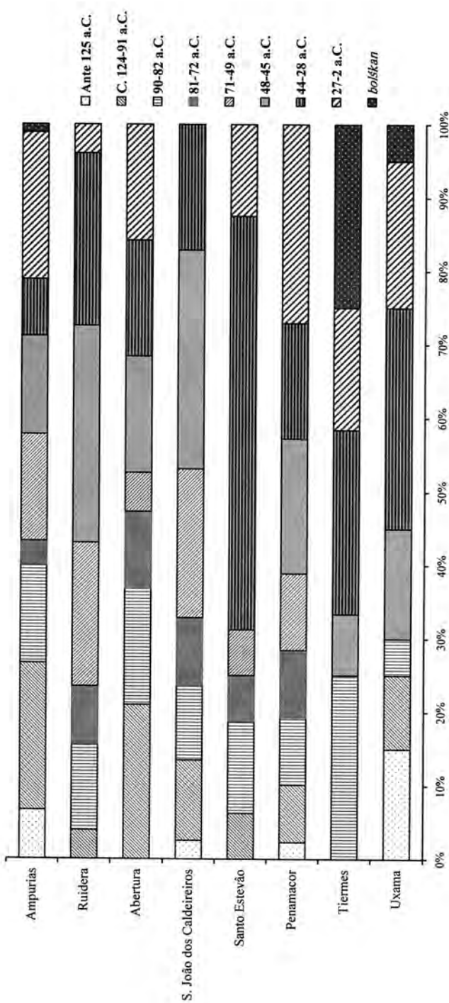
Fig. 7. Gráfico con la composición de los tesoros augusteos citados en el texto.