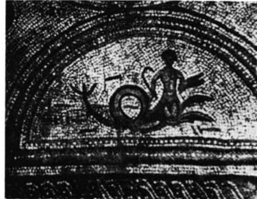
Mosaico de Casariche.