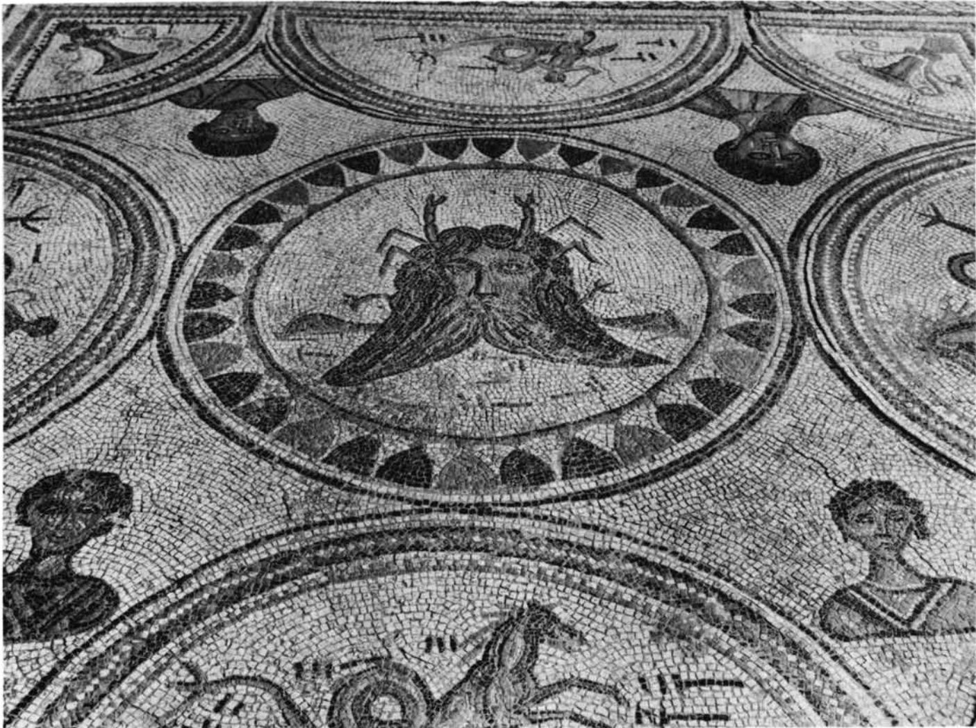
El mosaico de Casariche en su emplazamiento en Viñuelas (Madrid).