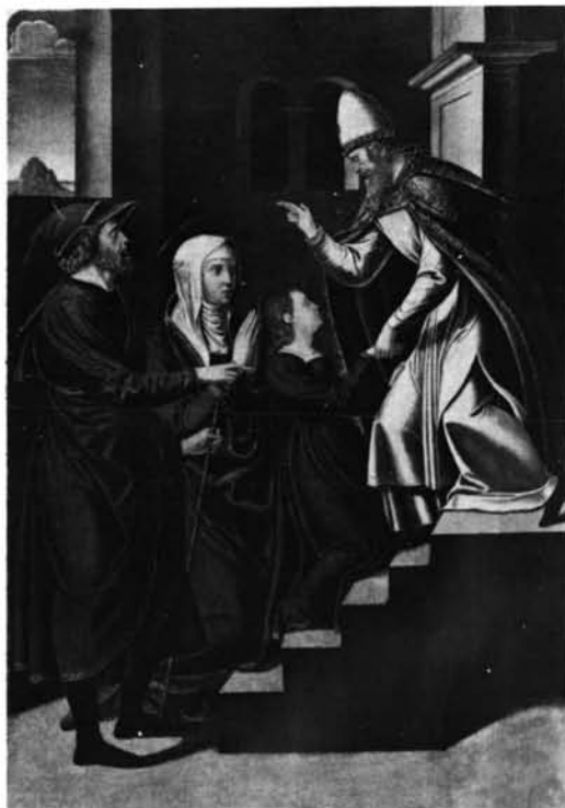
Belver de los Montes (Zamora). Iglesia parroquial. Retablo mayor: 1. El retablo antes de la restauración.—2. Santa Lucía.—3. Joaquin y Ana expulsados del templo.—4. Presentación de la Virgen en el templo.