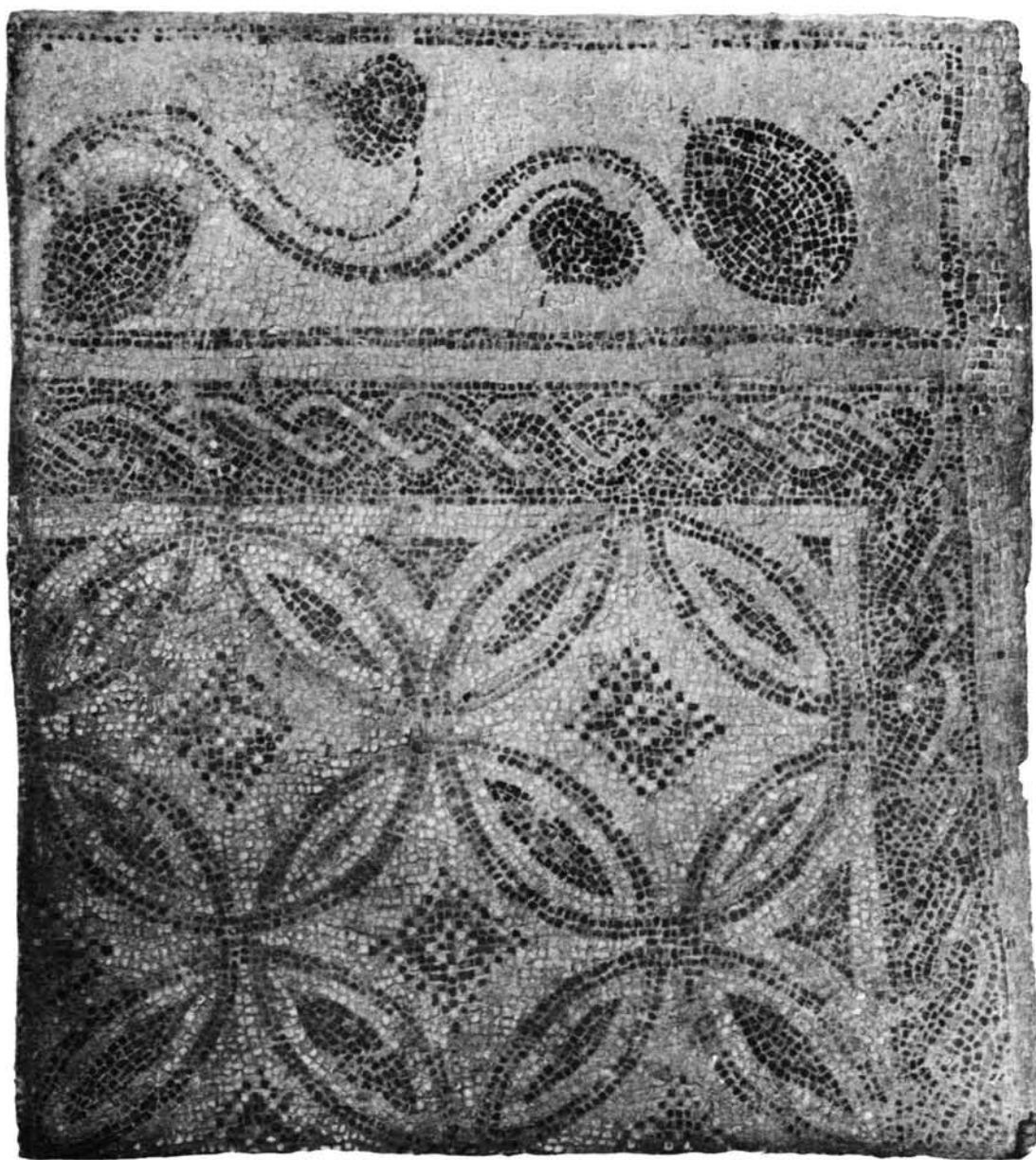
Villa romana de Pachs. Mosaico policromo "A".