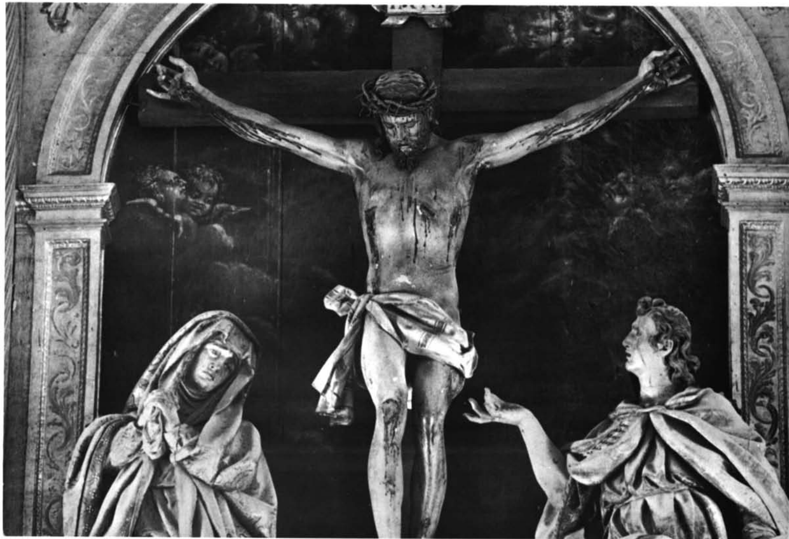
Miranda do Douro (Portugal). Catedral. Calvario, del retablo mayor, por Gregorio Fernández.