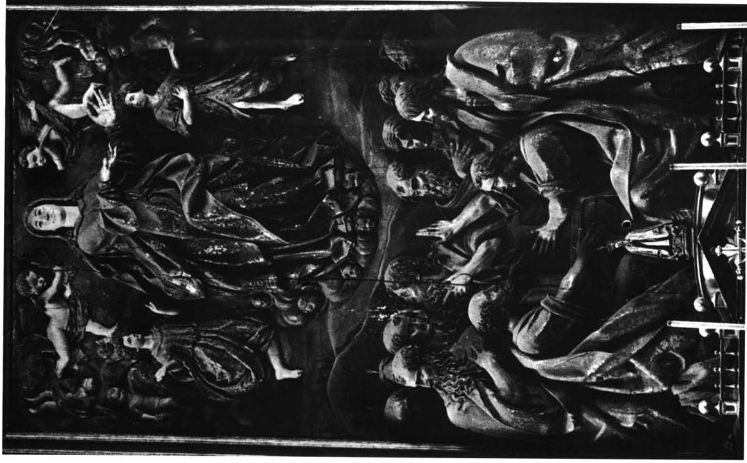
Miranda do Douro (Portugal). Catedral. Asunción, del retablo mayor, por Gregorio Fernández.