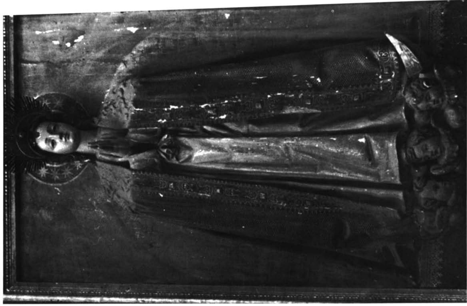
Miranda do Douro (Portugal). Catedral. Inmaculada, del retablo mayor, por Gregorio Fernández.