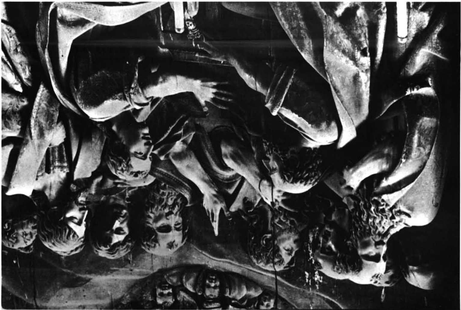
Miranda do Douro (Portugal). Catedral. Asunción, del retablo mayor, por Gregorio Fernández. Detalle.