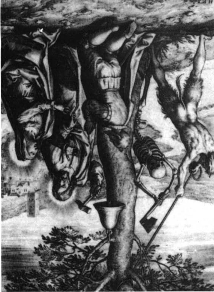
1. Catedral de Segovia. El Arbol del Pecador, por Ignacio de Ries.—2. Arbol del Pecador, por Jerónimo Wierix.