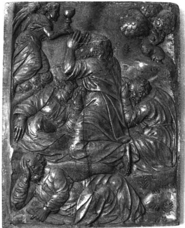
1. Canicosa de la Sierra. Parroquial. Retablo.—2. Hormicedo. Parroquial. Relieve de la Oración en el Huerto.