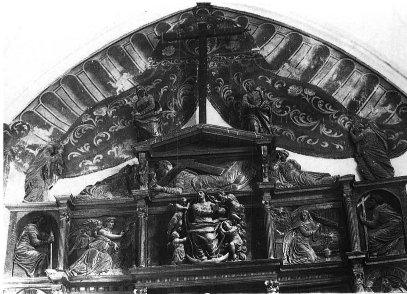
Quintanilla Riofresno. Parroquia. Detalle del retablo mayor.