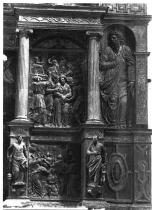
1 y 2. Tórtoles de Esgueva. Parroquial. Detalles del retablo mayor.—3. Villorejo. Parroquial. Detalle del retablo mayor.—4. Quintanilla Riofresno. Parroquial. Detalle del retablo mayor.