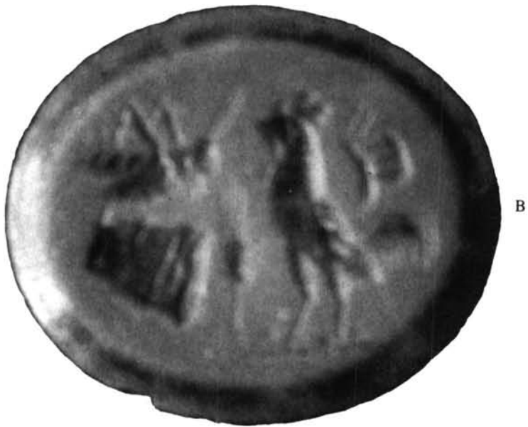
Fig. 1. A. Dibujo a escala del entalle padillense; B. Fotografía del mismo.