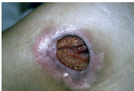
Ilustración 4: Categoría IV- Pérdida total del espesor de los tejidos