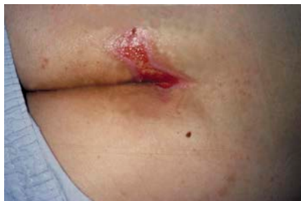
Ilustración 2: Categoría II- Úlcera de espesor parcial