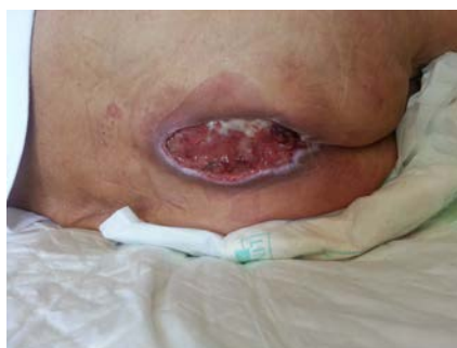
Ilustración 3: Categoría III- Pérdida total del grosor de la piel