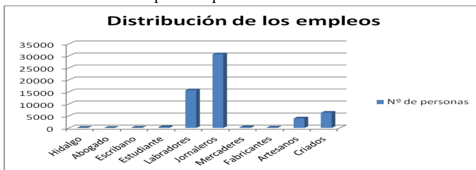
Gráfico 2.2 Distribución de la población activa segoviana de la época.

Estos dos oficios suman un total de cuarenta y seis mil trabajadores, por lo que la mitad de los segovianos se dedicaban a trabajos agrícolas. La población segoviana destacaba por ser jornaleros pobres que trabajaban las tierras de familias segovianas que cada vez eran más ricas. Como dice Larruga 2 ; “Algunos quieren persuadir, que esta provincia es rica, porque hay un puñado de gentes a quienes se les cuenta con caudales [...] que levantan mas y mas cada día y debilitan al mismo tiempo a los que no las tienen”.