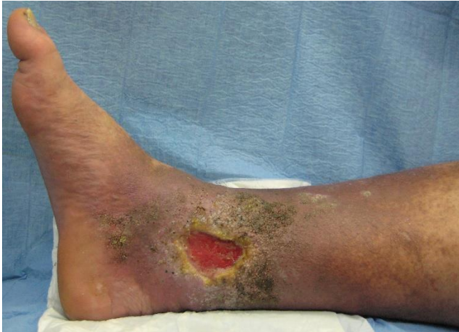
IMAGEN IV. ÚLCERA ARTERIAL