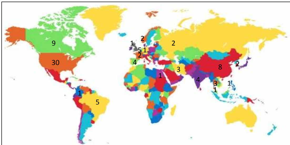
Mapa 1. Distribución geográfica de los ensayos clínicos revisados

de los cuales 4 son españoles y 2 son del IOBA, en los que se han utilizado células madre de médula ósea.