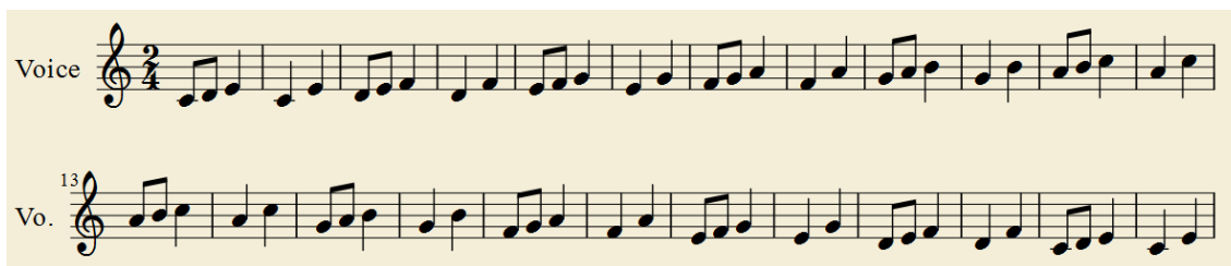
Imagen nº1: Ejercicios con la escala.

Después trabajaremos la entonación de las notas desde Do grave a Do agudo con el siguiente ejercicio.