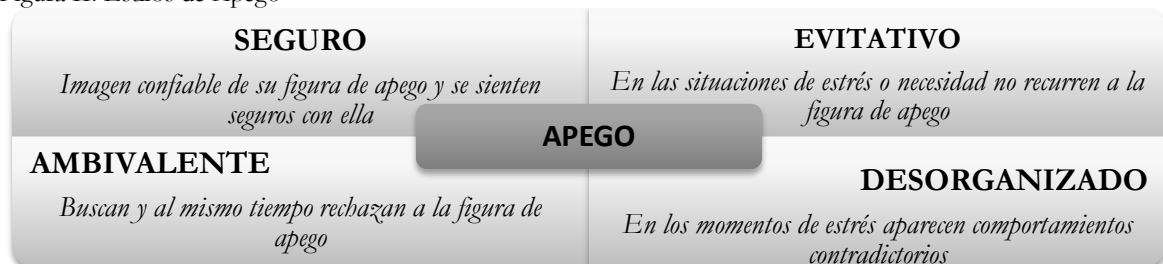
Figura II. Estilos de Apego

UVa