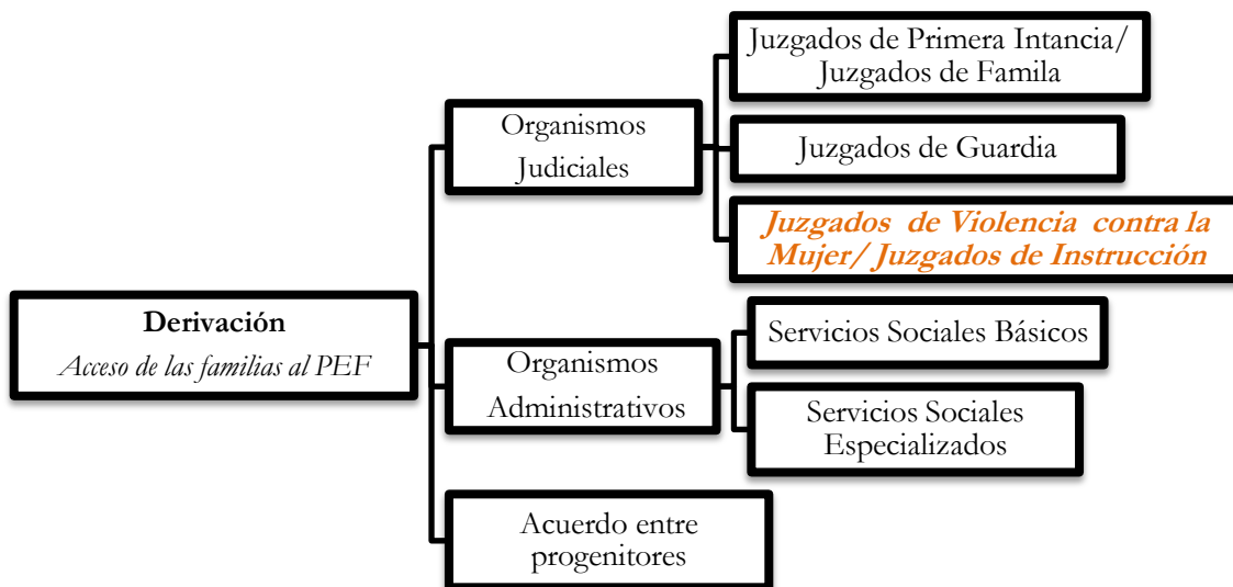
Esquema I. Derivación al Punto de Encuentro Familiar

El comienzo de la intervención en los PEF se vincula a diversas circunstancias que se pueden observar en el siguiente esquema (véase Esquema I).