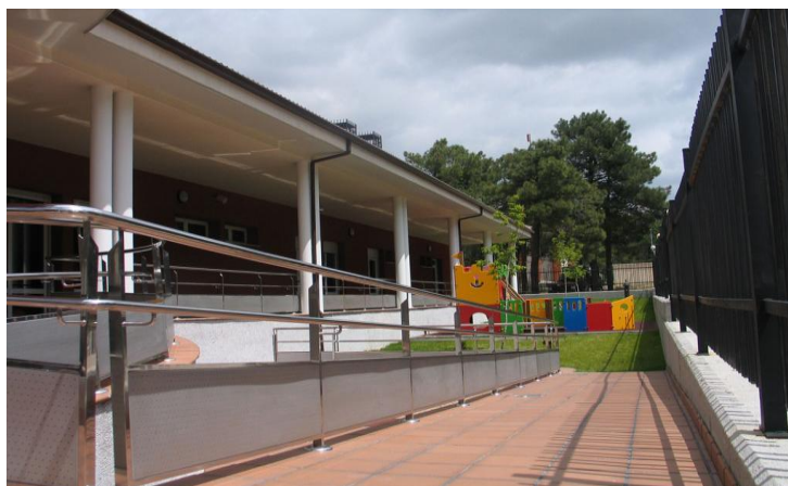
(PÁGINA OFICIAL DEL AYUNTAMIENTO DE CANTALEJO)