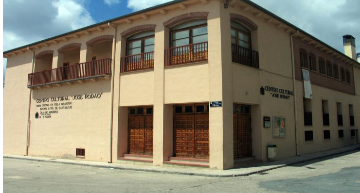
(PÁGINA OFICIAL DEL AYUNTAMIENTO DE CANTALEJO)