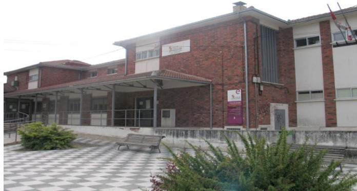
(PÁGINA OFICIAL DEL AYUNTAMIENTO DE CANTALEJO)