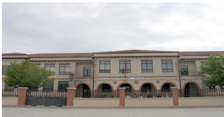
(PÁGINA OFICIAL DEL AYUNTAMIENTO DE CANTALEJO)