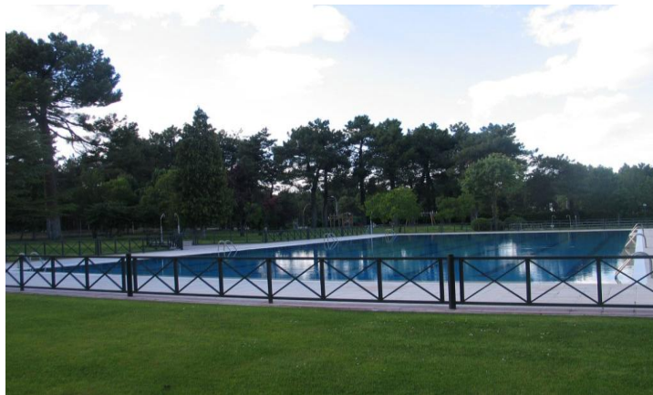
(PÁGINA OFICIAL DEL AYUNTAMIENTO DE CANTALEJO)