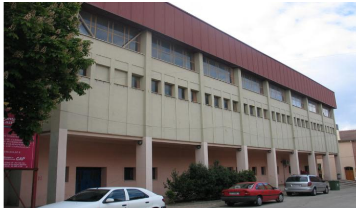
(PÁGINA OFICIAL DEL AYUNTAMIENTO DE CANTALEJO)