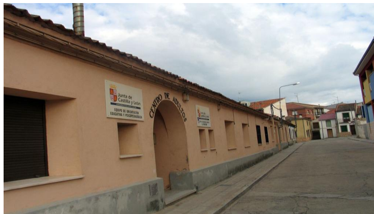
(PÁGINA OFICIAL DEL AYUNTAMIENTO DE CANTALEJO)