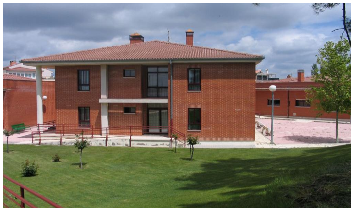
(PÁGINA OFICIAL DEL AYUNTAMIENTO DE CANTALEJO)