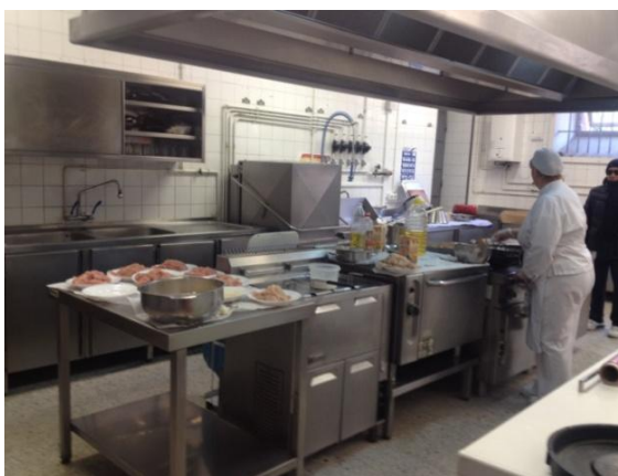
Ilustración 7: cocina

El comedor escolar del centro cuenta con una sala amplia donde los alumnos comen organizados por edades. Los más pequeños (Educación Infantil) tienen su sitio colocado y utilizan un babi para no mancharse. Dentro de la sala existe un armario donde colocar las pertenencias de los más pequeños. También hay lavabos. Cuenta con cocina propia. Es el único centro de la provincia que dispone de este servicio ya que en el resto, la comida es suministrada por una empresa de catering.