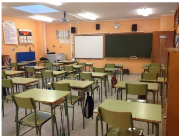
Ilustración 2: Distribución del aula de sexto curso

En la primera imagen podemos ver la distribución más habitual de las mesas de los primeros cursos, en este caso se trata de un aula de un grupo de segundo curso. Además, podemos ver la alfombra verde al fondo donde en diversos momentos del día los escolares y la maestra se reúnen abandonando temporalmente los pupitres. La segunda imagen muestra cómo en los cursos más altos, la distribución de las mesas cambia, alineándose en filas de a uno de frente a la pizarra.