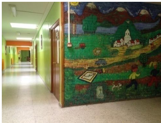
Ilustración 9: pasillos

Además, durante la entrevista a los profesores, nos comentan que a la hora de realizar actividades de movimiento o corporales tienen dificultades y que entre las propuestas está el llegar a usar los pasillos.