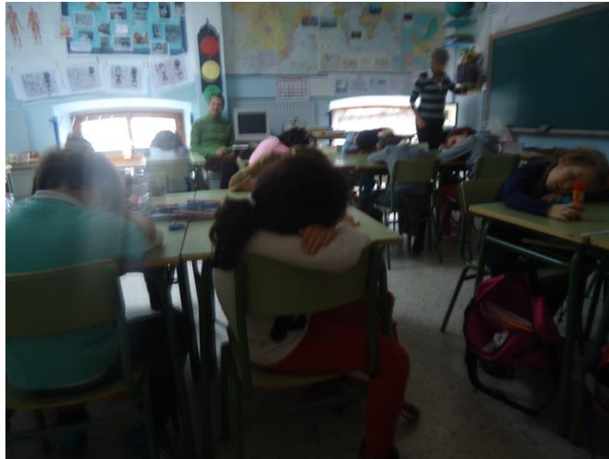
Ilustración 17: Relajación después del recreo

cuando llegan del recreo les cuesta habituarse a lo que son las clases, a la "seriedad de las clases", por lo que estas pequeñas actividades les ayuda. Igualmente nos hablan de que el recreo es fuente de conflicto y, para algunos al menos, de ansiedad. Esto viene a contradecir la idea que justifica en muchos casos la existencia de un recreo para aliviar tensiones provocadas por la inmovilidad solicitada en el aula.