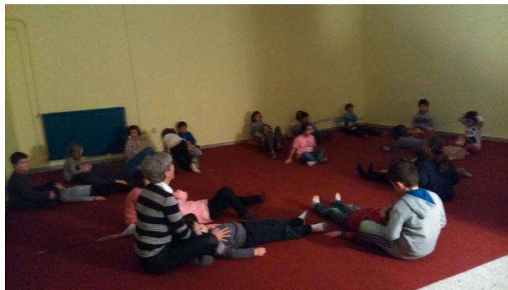
Ilustración 16: alumnos de 2º curso haciendo ejercicios de relajación en el "aula de movimiento"

A continuación, cambian a Lengua, realizando otra pequeña exposición ( cuerpo expuesto ). Finalmente, bajamos a la sala que han llamado "aula de movimiento" donde realizan una cuña motriz y una danza.