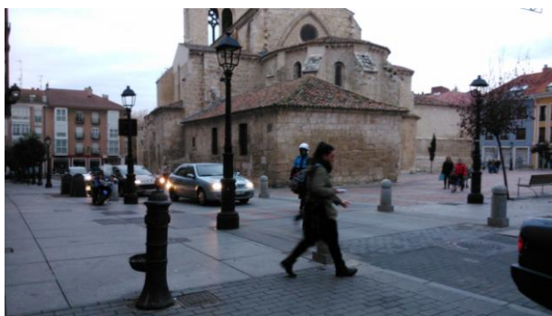
Ilustración 11: alumnos llegando al centro en coche

Los primeros alumnos comienzan a llegar al centro en torno a las 8:50. Entran a la zona del patio interior y allí se forman filas y se espera a que a las 09:00 suene la alarma que indica el inicio de la jornada. Una de las cosas que más me llama la atención de la llegada al centro es la cantidad de coches que se amontonan en la puerta, ya que son muchos los alumnos los que vienen hasta la puerta en coche. El resto vienen andando acompañados por sus padres o en pequeños grupos de compañeros en el caso de los más mayores (RO/ 01).