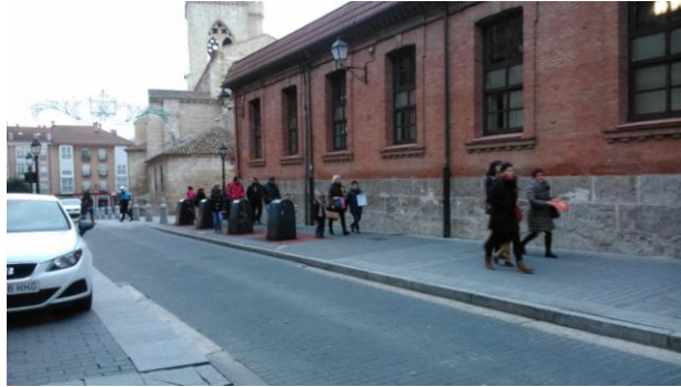
Ilustración 12: alumnos llegando al centro a pie

En estas dos imágenes observamos cómo es la llegada al centro. En la imagen 11 podemos ver la cantidad de coches que se amontonan a la entrada debido a los alumnos que usan este medio para asistir a la escuela. En la número 12, vemos a los alumnos que acuden a pie, acompañados por adultos. Pese a la relativa tranquilidad y la dimensión reducida de Palencia, los alumnos tienen una dependencia total de los adultos para ir al centro escolar, lo que habla de las escasas oportunidades de autonomía que tienen en este aspecto.