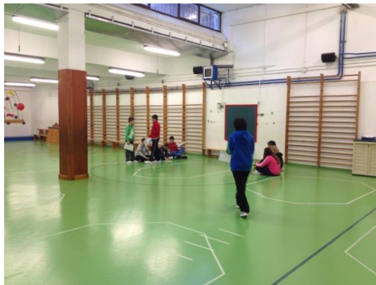
Ilustración 3: Gimnasio

Los profesores nos comentaron que solo se permite usar el gimnasio durante las clases y no durante el periodo del recreo. Es decir, solo tiene un uso formal y no está permitido un uso informal o más espontáneo por parte de los escolares.