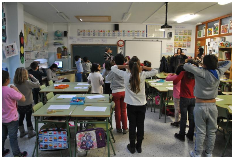
Ilustración 14: alumnos haciendo un ejercicio de relajación