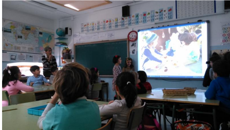
Ilustración 13: dos alumnas haciendo una exposición al frente de la clase