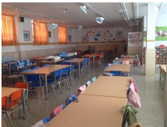
Ilustración 8: comedor escolar

En la séptima ilustración vemos la cocina del centro y a una de las trabajadoras. En la ilustración 8, vemos la organización del comedor escolar. En aquellas donde comen los más pequeños están los babis preparados.