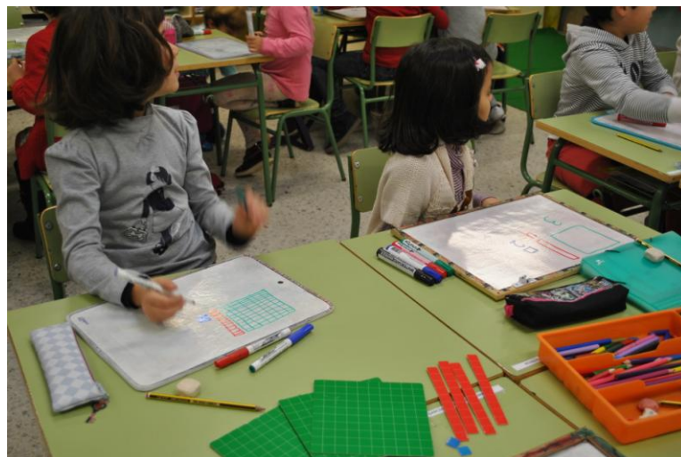
Ilustración 15: alumnas de segundo curso haciendo actividades de matemáticas