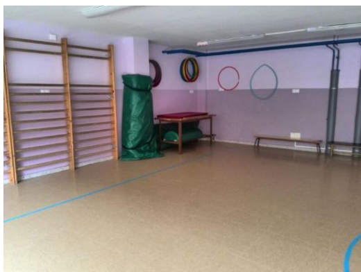
Ilustración 6: sala de psicomotricidad

En las ilustraciones 6 y 7 podemos ver cómo es la sala de psicomotricidad. Se trata de un espacio más bien reducido donde podemos ver diferentes materiales como espalderas o bancos, balones, aros. En la ilustración 6 podemos observar cómo la columna está protegida por una colchoneta por seguridad. Al igual que ocurría con el gimnasio, el diseño original del centro escolar no contemplaba la existencia de una sala de psicomotricidad.