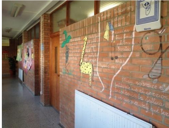
Ilustración 10: pasillos

En las imágenes 9 y 10 podemos ver cómo durante las clases no se ve movimiento en los pasillos y están desiertos. Además, son grandes y están decorados por los propios alumnos. Sí nos fijamos en la ilustración 10, podemos ver una señal, en blanco y azul, que indica que hay que permanecer en silencio por los pasillos.