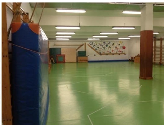
Ilustración 4: Gimnasio

En estas imágenes podemos observar más claramente cómo es el gimnasio del colegio. Lo que más nos llama la atención es la columna que está en todo el centro ya que limita mucho de los movimientos de los alumnos y no permite realizar todo tipo de juegos. Este espacio no se construyó originalmente pensando en su uso como gimnasio y es por ello que se encuentra ahí la columna. Este espacio se ganó para la Educación Física por la necesidad de contar con un espacio cubierto para el área de Educación Física debido a la importancia que esta área fue ganando con la legislación educativa emanada de la LOGSE (1990). Esto nos habla de la conexión entre arquitectura escolar y currículum.