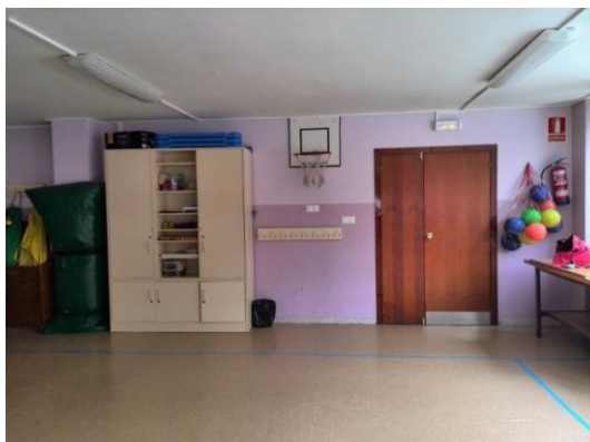
Ilustración 5: Sala de psicomotricidad

La sala de psicomotricidad es utilizada por el alumnado de infantil para mejorar sus competencias motrices; y para el alumnado del primer ciclo de educación primaria. También el programa de madrugadores usa esta sala, lo mismo que aquellos alumnos que se quedan en el centro después de comedor.