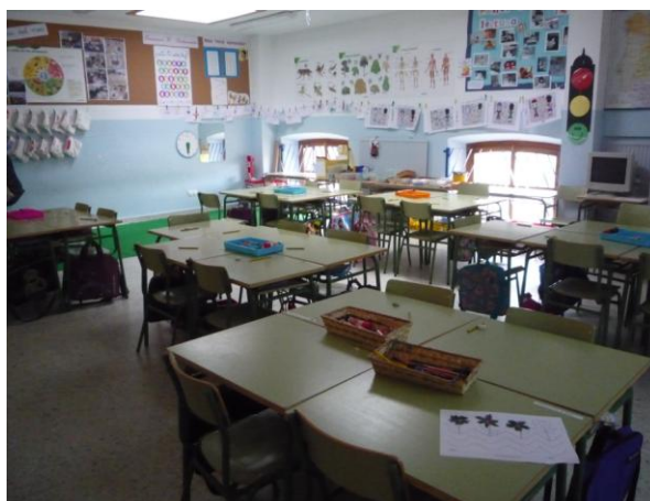
Ilustración 1: Distribución del aula de segundo curso

En todas las aulas nos encontramos con dos pizarras: una tradicional y otra digital, que se encuentra al frente de la clase, al igual que la mesa del profesor. Las aulas de infantil están organizadas por rincones.