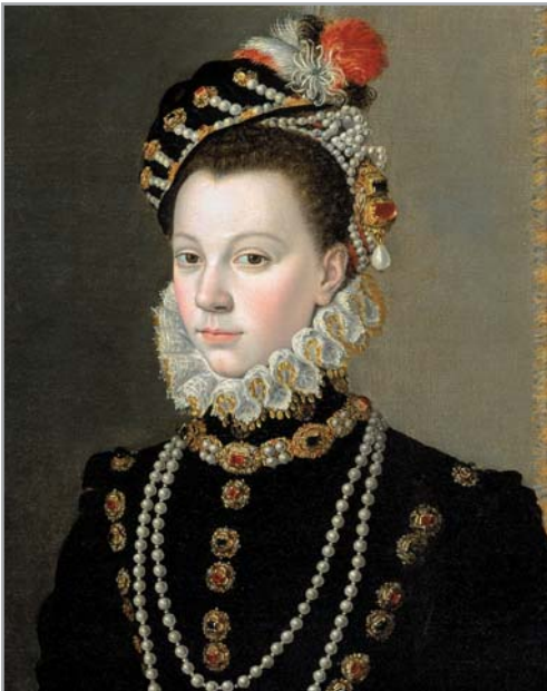
Figura 2.- Isabel de Valois