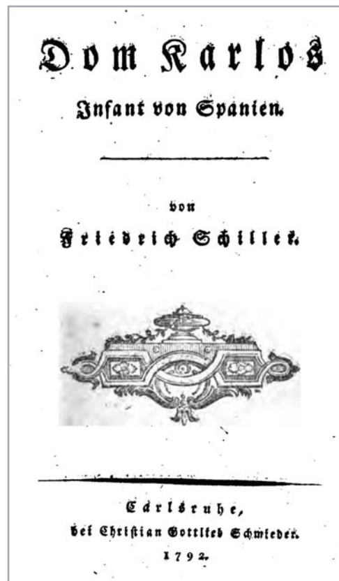
Figura 4.- Dom Karlos, Schiller

En el II se nos pinta la angustia que se ha apoderado de Don Carlos viendo al objeto de sus amores esposa de su padre,