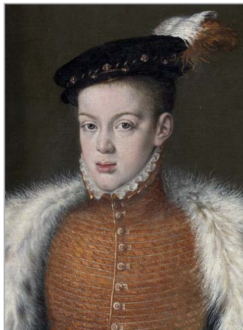
Figura 1.- Don Carlos.

Pero la historia avanza, enriqueciendo con matices lo que antes solamente era blanco y negro. Es lo que han venido a hacer los austriacos a España grabando un documental titulado Desnudando a Schiller , mostrando la improbabilidad del asesinato del príncipe Carlos por su propio padre y por el moti-