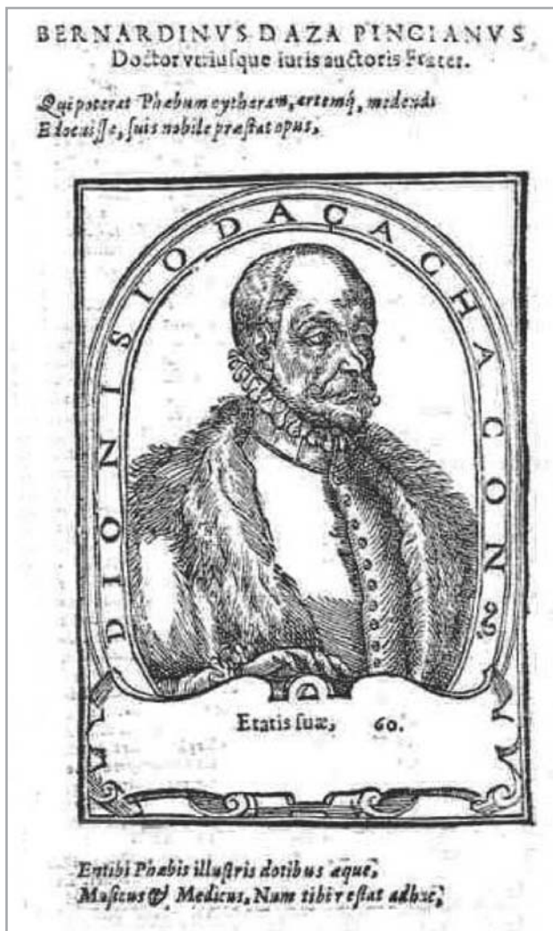
Figura 10.- Retrato de Dionisio Daza.

informaba de que era: "inmoderado en el comer, se empazaba de cantidades suficientes para satisfacer a dos o tres personas" (Hernández, 318).