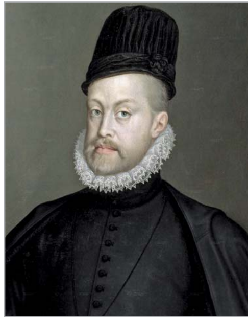
Figura 3.- Felipe II

vo de apoyar la causa de la independencia de los Países Bajos. La muerte del príncipe es un clásico de la historiografía europea, en el que el tiempo ha ido apartando a los estudiosos del camino del homicidio, para reconducirlos hacia la medicina, hacia la enfermedad y la locura heredada de Juana la loca, o adquirida tras la herida en la cabeza que se hizo al rodar por unas escaleras.