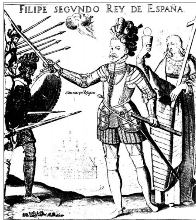
Figura 8.- Felipe II en la Historia de Cabrera.

Tal vez para compensar el robo de la prometida, se le propuso otra nueva, la inglesa María Estuardo, que Don Carlos rechazó: "me respondió y ha dicho algunas veces no quererse casar" , escribió el rey. Simultáneamente, se le hizo proclamar y jurar por Príncipe de Asturias, en Toledo, el 22 de febrero del año de las bodas de su padre, 1560.