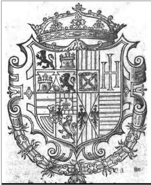
Figura 7.- Escudo de armas de don Carlos

El V y último acto es truculento. Los secuaces del Gran Inquisidor, los monjes del Santo Oficio, localizan a Don Carlos y quieren matarlo, este saca la espada para defenderse, pero no hay caso. Están junto a la tumba de su abuelo, el emperador Carlos V, y su espectro surge de la tinieblas para agarrar y arrastrar por la fuerza al príncipe hasta su última morada, diciendo: Hijo mío, los dolores de la tierra / se vienen a expirar en este sitio / ¡La paz que vuestro corazón espera / sólo se encuentra al lado de Dios! Mientras espectro y Don Carlos hacen mutis por la tumba, el Gran Inquisidor exclama: ¡Es la voz del emperador! ; Felipe II: ¡Mi padre; e Isabel de Valois: ¡Oh, cielos!