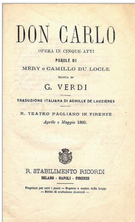
Figura 5.- Don Carlo, Verdi.

más cuando Isabel parece haberse olvidado de él, cosa que no es cierta; pero es una princesa perfectamente educada para reina, y sabe que es mejor disimular y comportarse como lo que debe ser, una mujer fiel.