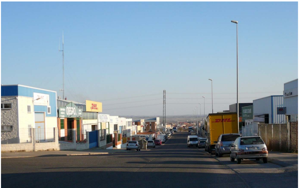
Figura 4.- Polígono industrial (parque de proveedores de servicios) de la Hiniesta en la ciudad de Zamora.

construida-, enclavado dentro del complejo que en su día constituyó la Granja Escuela La Aldehuela en Zamora. Con las excepciones apuntadas, el grado de ocupación de los polígonos de segunda generación –los construidos a partir del año 2000- es muy bajo, como consecuencia de haberse sumado a la tradicional atonía del sector, la profunda crisis financiera y económica en general de la segunda mitad de la primera década del siglo XXI; es probable, no obstante, que buena parte de sus parcelas hayan sido compradas –con intención de utilizarlas, o no- y que su ocupación se haya aplazado por razones económicas, es decir, por no encontrar compradores-emprendedores en la crítica coyuntura actual -2012-. Esta sería, por otra parte, la causa de la ralentización de algunos proyectos de nuevos polígonos industriales como los de Pobladura del Valle, de más de 100.000 m 2 , o el de Villanueva de Azogue, que se encuentra todavía en una fase embrionaria; dispondrá de más de 1.000.000 de m 2 y en 2012 tan sólo había dado el primer paso: la recalificación de suelo.