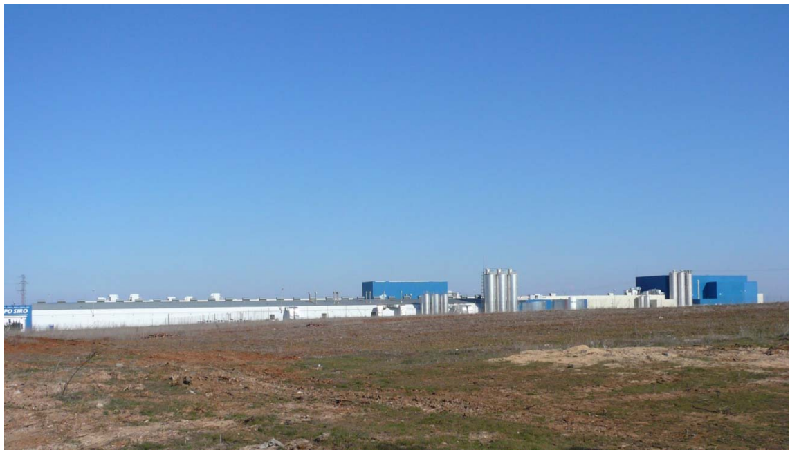
Figura 5.- Dos pilares de la industrialización tradicional en la provincia de Zamora: Azucarera Ebro y fábrica de galletas Reglero –Grupo Siro- en Toro