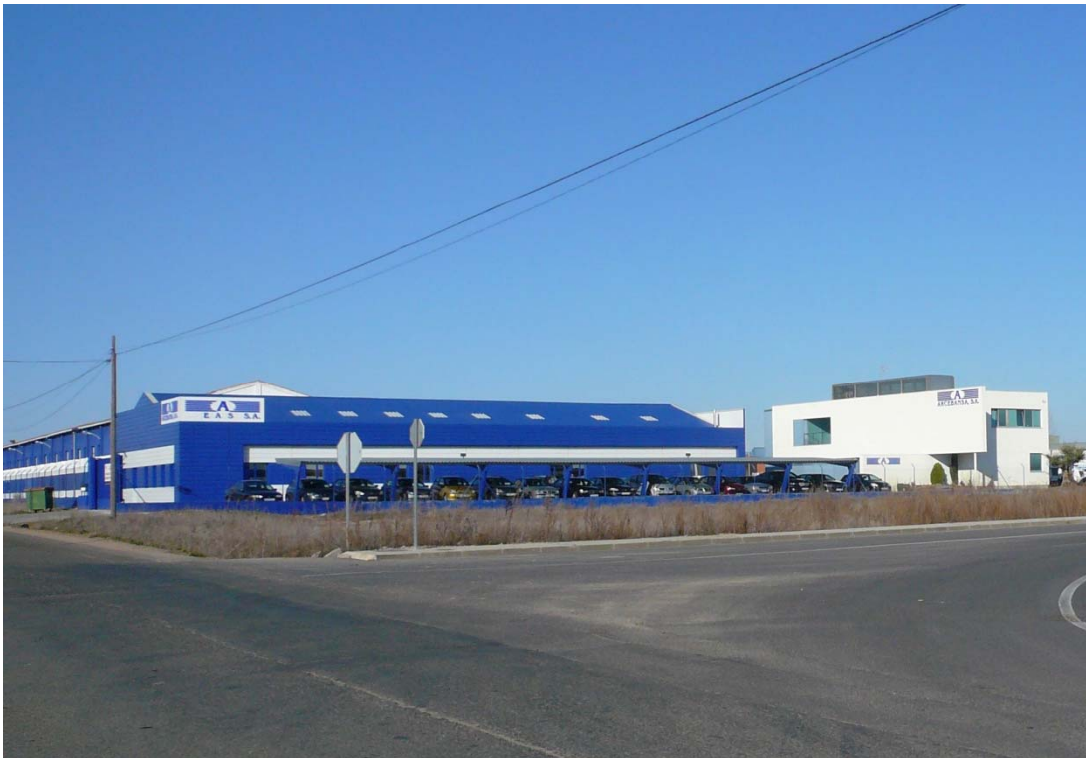
Figura 6 .-Dos polígonos con mucha energía: Planta de la empresa Alstom -infraestructuras de generación y transmisión de energía- en el polígono Industrial Los Pinares en Coreses, y factoría de Arcebansa en el polígono Campo de Aviación en Coreses - producción y comercialización de energía eléctrica solar fotovoltaica-.