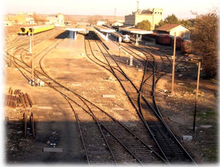
Figura 1: El tiempo detenido. Complejo ferroviario de Zamora en 2003, Cincuenta años después de su inauguración.

Las memorias de la Cámara de Comercio y la prensa local irán recogiendo, año tras año, el creciente optimismo que el desarrollo de las obras del ferrocarril provocaba entre las llamadas clases productoras , pero hubo que esperar cerca de un cuarto de siglo para que, tras sufrir múltiples aplazamientos -2ª República, Guerra Civil ...- , el 24 de Septiembre de 1953 se inaugurase el tramo Zamora-Puebla de Sanabria; tres años más tarde, el 2 de Julio de