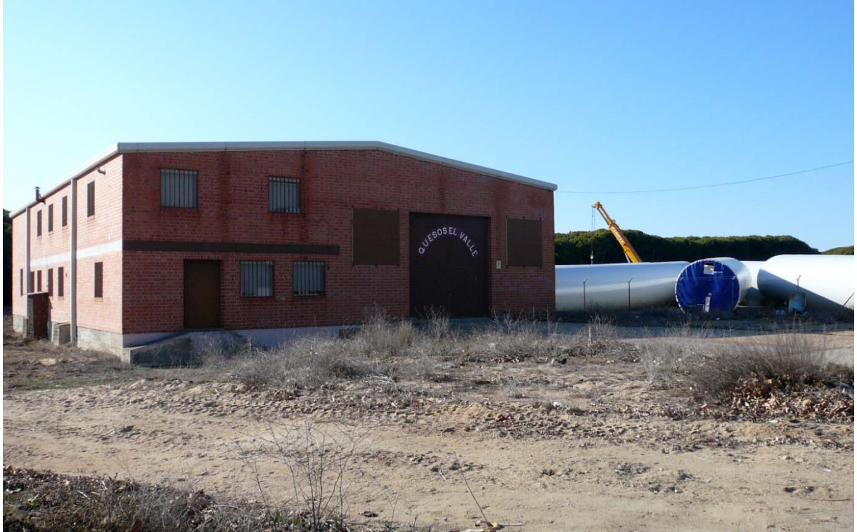
Figura 3. Tradición y modernidad en la industria de la provincia de Zamora: Fábrica de quesos el valle y solar de depósito de stocks la empresa Alstom -infraestructuras de generación y transmisión de energía en el polígono Los Pinares de Coreses.

Gran parte de ese tejido productivo está compuesto por pequeñas empresas cuyo objeto no es otro que la prestación de servicios y el abastecimiento de bienes –alimentación, productos metálicos ligeros, material eléctrico, artes gráficas etc...en los que al factor productivo y obviamente el valor añadido es relativamente escaso. 41 El paisaje industrial característico es el formado por la pequeña empresa industrial dispersa, en ocasiones agrupada y apoyada en las carreteras de acceso a los núcleos urbanos, a las que se han ido sumando y en número creciente, las asentadas en los polígonos industriales que se han ido creando en los últimos años –ver cuadro 7-.