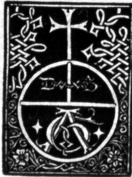
FIGURA 3 Fol. a6v de la Secunda repetitio (V.B.5622 A 4 LP)