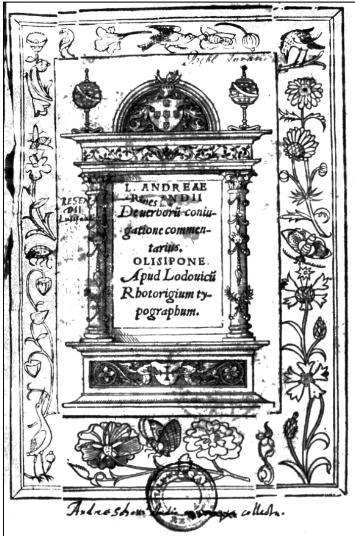
FIGURA 1 Portada de V.B.5622 A 1 LP, con anotaciones manuscritas de Schott