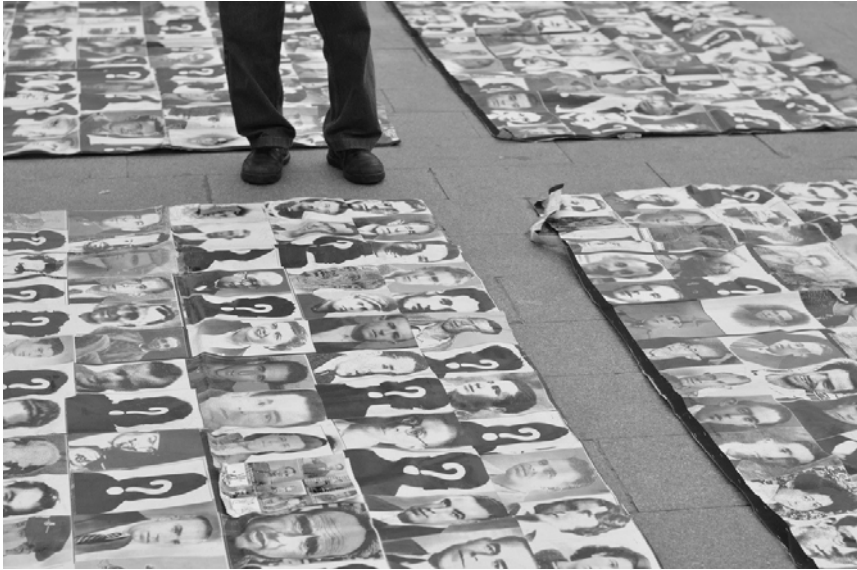
Imagen 1. Representación de las víctimas del franquismo en Sol, Madrid. 2013.

A partir de ese momento, y en base a esas afinidades en las reclamaciones, se ha empezado a producir una narrativa sobre la desaparecida del franquismo lejos del discurso oficial del “todos fueron culpables” (Izquierdo, 2013) y de la clasificación habitual entre “franquistas” y “rojos”, “sublevados” y “republicanos”. Se empieza a hablar de víctimas de la dictadura tomando como referente el caso argentino, y la desaparecida se empieza a asociar a la tortura, ya no solo a las ejecuciones sumarias. Incluso el término desaparecido es de reciente incorporación, hasta el momento siempre se había hablado de ser paseado –fusilado y enterrado en una fosa común. El carácter de reciente factura, fuera del ámbito académico, de la construcción de la figura de la desaparecida del franquismo se articula en base a dos ejes: la memoria de familiares y supervivientes, y la exhumación de fosas comunes.