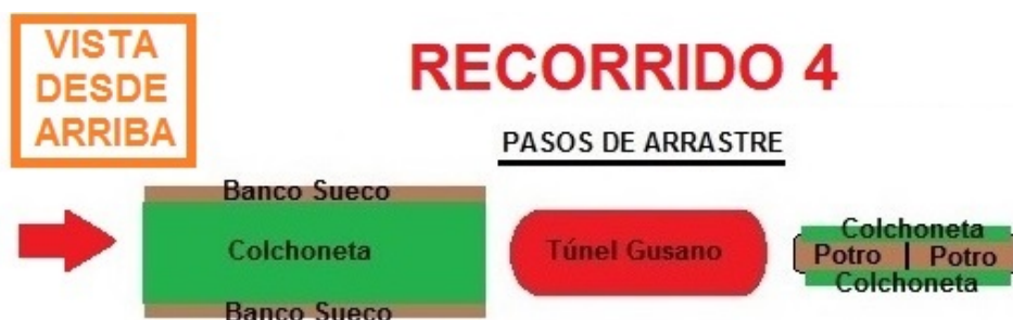
Figura 5. Recorrido 4, pasos de arrastre

El recorrido 4 (figura 5) consiste en 3 pasos de arrastre, el primero por debajo de una colchoneta colocada encima de dos bancos suecos, el segundo por un túnel de gusano, y el tercero por debajo de dos potros con los lados tapados por colchonetas.