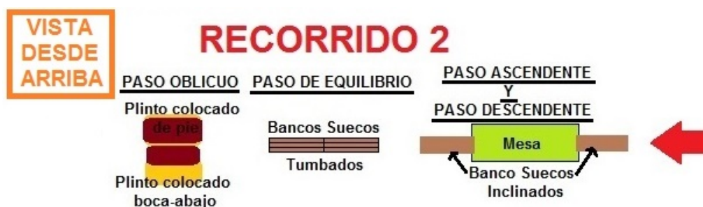
Figura 3. Recorrido 2, paso ascendente y descendente, paso de equilibrio y paso oblicuo

El recorrido 2 (figura 3) consiste en un paso ascendente y descendente por bancos suecos apoyados sobre una mesa, paso de equilibrio sobre bancos suecos tumbados, y paso oblicuo entre dos plintos.