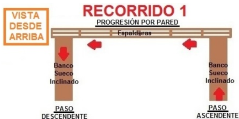
Figura 2. Recorrido 1, paso ascendente, progresión por pared y paso descendente

El recorrido 2 (figura 3) consiste en un paso ascendente y descendente por bancos suecos apoyados sobre una mesa, paso de equilibrio sobre bancos suecos tumbados, y paso oblicuo entre dos plintos.