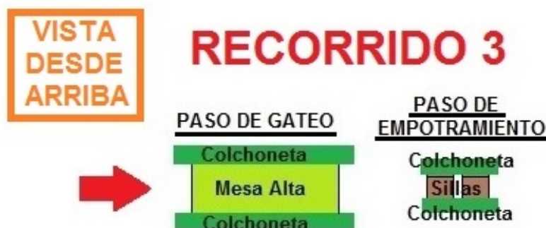
Figura 4. Recorrido 3, paso de gateo y paso de empotramiento

El recorrido 3 (figura 4) consiste en un paso de gateo por debajo de una mesa con los lados tapados por colchonetas, y un paso de empotramiento por debajo de las sillas con los lados tapados por colchonetas.