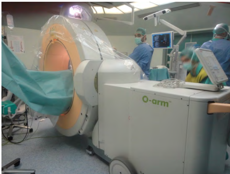
Fig. 7. Sistema de navegación O-arm

Este tipo de sistemas fueron desarrollados inicialmente para su uso en cirugía de columna vertebral y traumatología, ya que la alta densidad de los tejidos óseos permite obtener imágenes de gran calidad. Sin embargo su uso se ha extendido a diversos campos quirúrgicos; estando en expansión en el momento actual (11). Fig. 7.