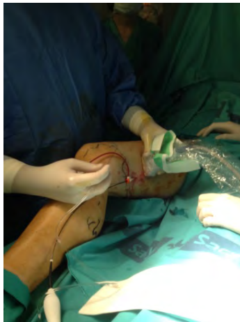
Fig. 5 Tratamiento endovascular de las varices

El síndrome varicoso, tratado tradicionalmente con la extirpación de los segmentos venosos afectado o la exclusión de la vena mediante la inyección de esclerosantes. Otras técnicas se han añadido al arsenal terapéutico para esta patología destacando las de esclerosis mediante la utilización de radiofrecuencia o laser.