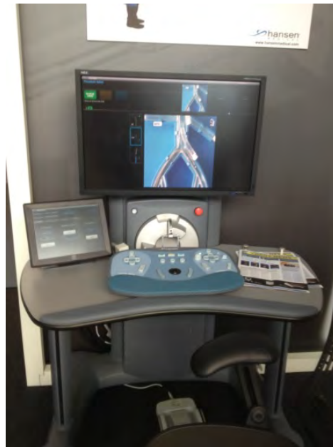
Fig. 8. Consola del robot endovascular Maguellan

El intento de robotización de la técnica quirúrgica sigue vigente y para lo cual también en el campo endovascular se han realizado proyectos y desarrollado sistemas de robotización aunque sí sólo existe un dispositivo destinado a ayudar a realizar estas técnicas de una forma más sencilla y sobre todo más precisa. El modelo existente y ya comercializado debe de demostrar su eficacia y sigue pendiente de valoración. (11) Fig. 8.