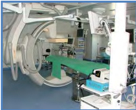
Fig. 6. Sala con quirófano híbrido

Inicialmente, para realizar este tipo de técnicas, se realizaron en las salas de radiología, aprovechando estas, inicialmente diseñadas para otros fines. Posteriormente, y base de unos requerimientos quirúrgicos, fundamentalmente por la necesidad de realizar procedimientos híbridos o por la precaución de poder solventar de una forma adecuada las posibles complicaciones derivadas de los procedimientos endovasculares, comenzaron a realizarse en los quirófanos convencionales complementados con medios radiológicos tipo arco. En el primer caso, las salas no estaban acondicionadas para realizar procedimientos convencionales si eran necesarios al desarrollar los procedimientos, al no disponer ni de aparatos de anestesia, ni mesas operatorias adecuadas, ni instrumental quirúrgicos, medios de resucitación, infraestructura quirúrgica o la capacitación de los propios profesionales para realizarlas. En el caso de los quirófa-