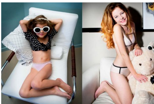
Figura 6.12 Anuncio de ropa interior.

sexualización precoz, niñas que dejan atrás su papel infantil para convertirse en pequeñas mujeres objeto. Todo el mundo está expuesto a la publicidad, incluso aquella que no va dirigida a niños y niñas, llega a este público. Quieren imitar todo aquello que ven, ser como sus ídolos, vestirse de la misma forma y bailar como ellos, incluso la ropa se ha adaptado a esto, sobretodo en el caso de las niñas, donde abundan los crop tops o otras prendas que dejen a la vista partes del cuerpo consideradas sexys entre la gente adulta o incluso sujetadores para preadolescentes con encajes y lazos. Vestuarios sexualizados que no corresponden con la ropa que debería llevar una niña de 10 años. Las jugueterías venden maquillaje y zapatos de tacón para niñas de entre 4 y 6 años, la función de estos juguetes no es otra que la belleza, hacer sentir guapas y sexys a las más pequeñas, que refuercen los estereotipos de que a las mujeres les gusta ir siempre bien vestidas, maquilladas, salir de compras o a tomar café y que siempre están fijándose en chicos. Juguetes adaptados y pensados solo para ellas, que imitan estas situaciones y promueven los roles de género socialmente aceptados para las mujeres. Se representa como algo natural, normal y necesario.