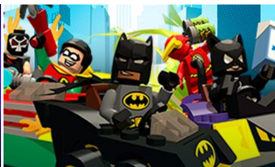
Figura: 8.15 Lego para ellos.

Las empresas que antes dirigían sus productos solo hacia el sexo masculino han decidido teñir el producto de rosa, para dirigirlo al otro público. Mismo producto, mismas características y funciones pero de color de rosa. O directamente se le añade la etiqueta “princesa” promoviendo así la idea del cuento ideal, la delicada mujer cuyo mayor objetivo en la vida debe ser estar guapa y preparada para encontrar al príncipe que se enamorará de ella por otros valores que no son la inteligencia.