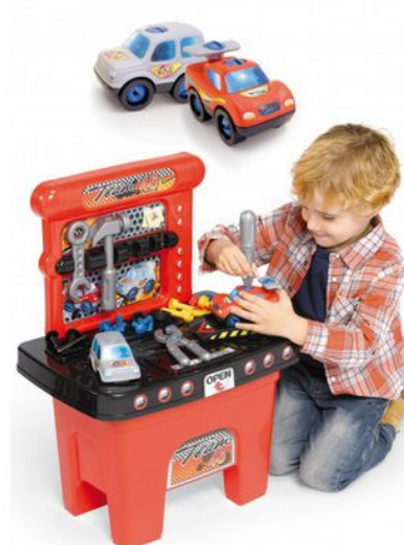
Figura 6.10 Banco de trabajo rojo

Los juguetes actuales no encajan con el año en el que vivimos, corresponden a roles de género de hace 20 años, los hombres hoy en día cocinan, de hecho los mejores chefs del mundo son