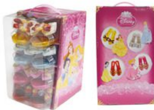
Figura 9.17 Caja de zapatos de tacón.

Los zapatos de princesa son todo un clásico, El Corte Inglés lanza para la campaña de Navidad un pack de 4 zapatos de tacón para niñas de 3 a 5 años de Disney. El soporte elegido en este caso es el papel. La tipología del juguete es aprendizaje imitativo de chicas. Fijan unos estándares de belleza femenina considerados como sinónimo de éxito. El soporte elegido en este caso es el papel, es un anuncio extraído del catálogo de juguetes de la pasada campaña de Navidad.