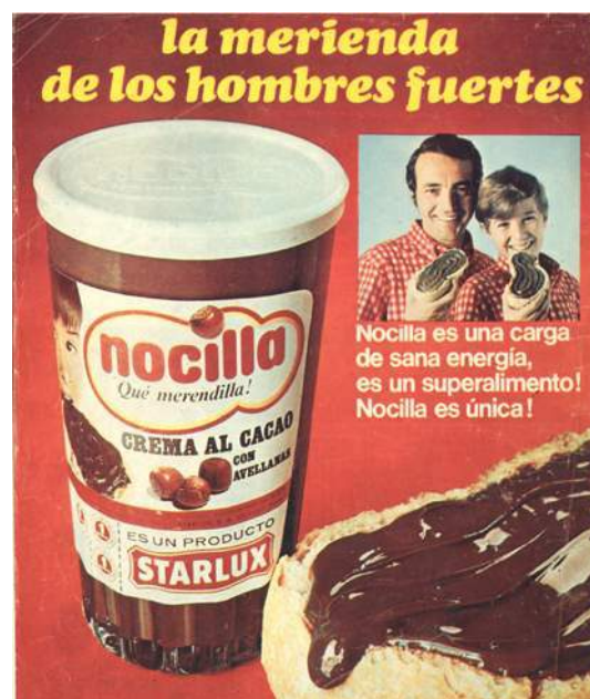
Figura 4.4 Anuncio de Nocilla años 70.

La belleza es uno de los elementos que marca la publicidad desde la aparición de esta y que aún sigue presente en todo aquello que nos rodea. Productos para luchar contra las imperfecciones del cuerpo. La salud y la higiene como valores para vender productos que prometen vidas de en sueño. Pero sobre todo la conquista del marido, ese era el objetivo de