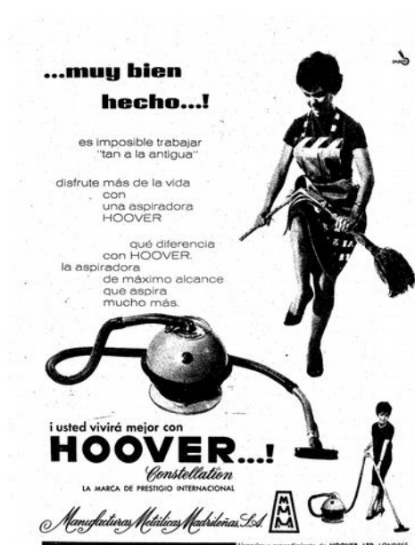
Figura 4.1 Anuncio de los años 70.