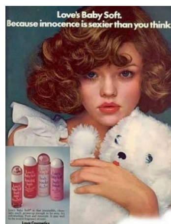
Figura 6.13 Sexualización de la infancia.