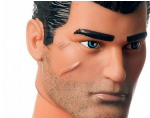
Figura 9.14 Rostro del muñeco Action Man.

Basándonos en el decálogo para identificar el sexismo en la publicidad, del observatorio andaluz de la publicidad no sexista, podemos determinar que se trata de una publicidad totalmente sexista porque según el punto 1 del decálogo es sexista la publicidad que promueve modelos que consolidan pautas tradicionalmente fijadas para cada uno de los género, es decir, anuncios que siguen perpetuando los roles tradicionalmente asignados a cada género, ajenos a los cambios sociales y a las nuevas realidades vividas por muchas mujeres.