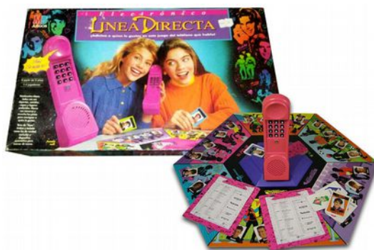
Figura 9.16 Juego de mesa años 90.

La voz en off es masculina que les dice lo que tienen que hacer, el patriarcado con voz y sin rostro nos dice que busquemos novio. Como decíamos anteriormente es bastante común que en anuncios dirigidos a mujeres se introduzca la voz masculina, porque da más autoridad y parece que nos dice lo que tenemos que hacer. Sin embargo una mujer no adquirirá ese papel en un anuncio dirigido a ellos.