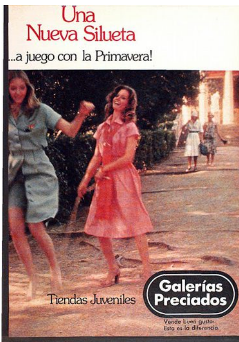
Figura 4.3 Anuncio de 1975.

La publicidad dirigida a las mujeres se basaba siempre en los mismos puntos: Persecución de la belleza para la conquista de un marido y productos para el hogar y el cuidado de la familia.