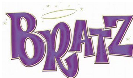
Figura 9.19 Logotipo

Ahora comprobemos si se corresponde con publicidad sexista teniendo en cuenta del decálogo para identificar sexismo en la publicidad, del observatorio andaluz de la publicidad no sexista. Según el punto 1 del decálogo es sexista la publicidad que promueve modelos que consolidan pautas tradicionalmente fijadas para cada uno de los género, es decir, anuncios que siguen perpetuando los roles tradicionalmente asignados a cada género, ajenos a los cambios sociales y a las nuevas realidades vividas por muchas mujeres. Claramente este producto perpetúa estos valores, no representa a las mujeres en trabajos de éxito, las convierte en mujeres cuyo único objetivo es la búsqueda de la belleza y la popularidad, a través de la ropa, el maquillaje, las fiestas.