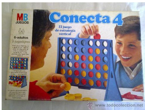
Figura 9.15 Caja del juguete años 90.

El packaging también confirma el mensaje, es la foto de un padre y su hijo jugando con el juego, no hay lugar para las niñas en un juego de inteligencia.