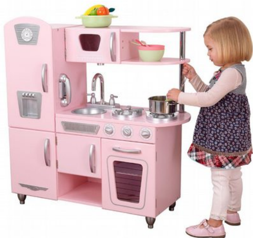
Figura 6.9 Cocinita rosa.

“Los juguetes son otra forma más de imponer y perpetuar la desigualdad en el reparto de funciones según el sexo, colaborando con ello al mantenimiento del sexismo”. Juegos y juguetes para la igualdad. Guía didáctica para una Educación No Sexista dirigida a madres y padres Rebolledo Deschamps, Marisa. (2009, p.23)