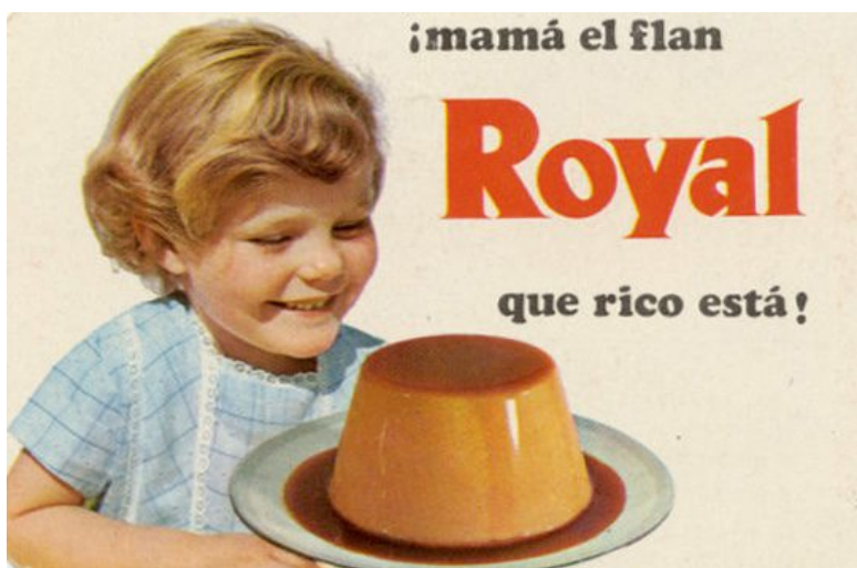
Figura 4.5 Anuncio Flan Royal años 70.

vida de las consideradas mujeres de verdad, su propósito de vida, aquello para lo que habían nacido. Anuncios marcados por la sociedad patriarcal en el que la mujer siempre se va a mostrar en inferioridad y dependencia de una figura con poder. Primero con productos que la vuelvan seductora y atractiva frente a su futuro marido y una vez casada los productos que la conviertan en la mujer y madre perfecta, todo un arsenal de productos de limpieza y utensilios para cocinar.