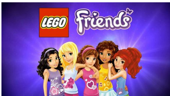
Figura 8.14 Lego para ellas.

Algunas marcas han decidido ampliar su público, empresas como Lego que dirigía sus productos principalmente a los niños recientemente ha sacado una línea de juguetes en color pastel denominada Lego Friends, dirigida a ellas, por supuesto la función de estos juguetes no será montar castillos, o barcos pirata como en la gama dirigida a ellos, en Lego Friends el objetivo será hacer amigas, decorar casas e ir de compras. Fomentan los estereotipos y promueven las actividades que son consideradas “de chicas”.