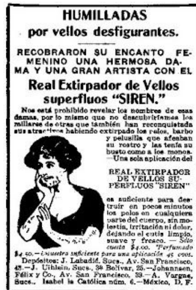
Figura 4.2 Anuncio de 1914