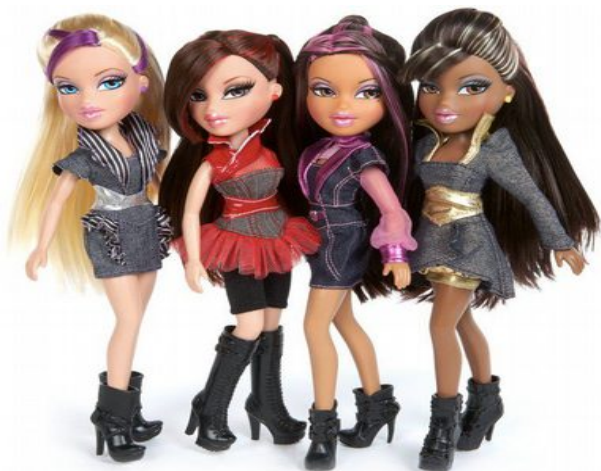
Figura 9.18 Muñecas Bratz.