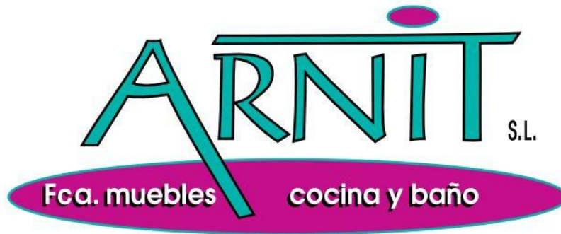
Figura 3.1 Logotipo de la marca Arnit.

mismo grosor que las propias líneas verticales y sin soporte pero con vértices levemente marcados. Un logotipo en el que la letra inicial de la palabra “A” y la letra final “T” destacan sobre el resto; el brazo derecho de la letra A, se prolonga más que el resto. Y con un extremo horizontal de la letra “T” ocurre lo mismo, encerrando al resto de letras del logotipo haciéndoles protagonista del mismo.