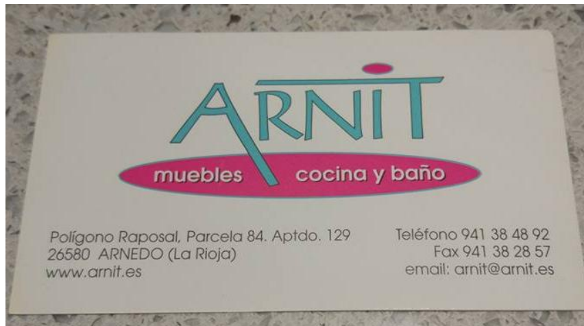
Figura 3.7 Tarjeta de visita