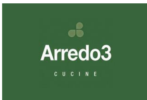
Figura 3.10 Imagen Corporativa Arredo