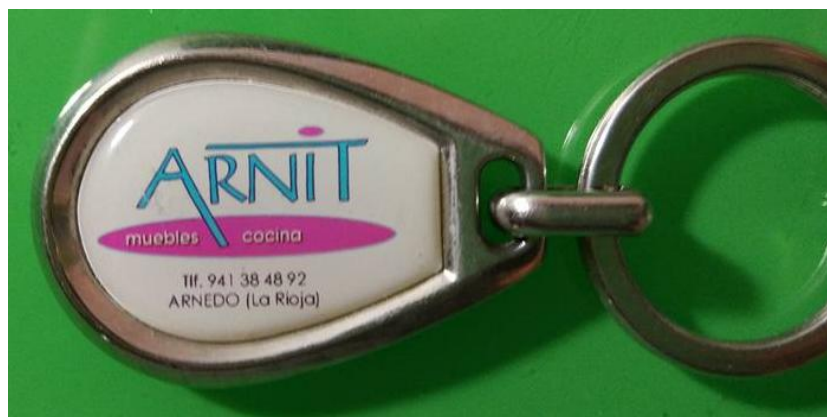
Figura 3.8 Material merchandising. Llavero