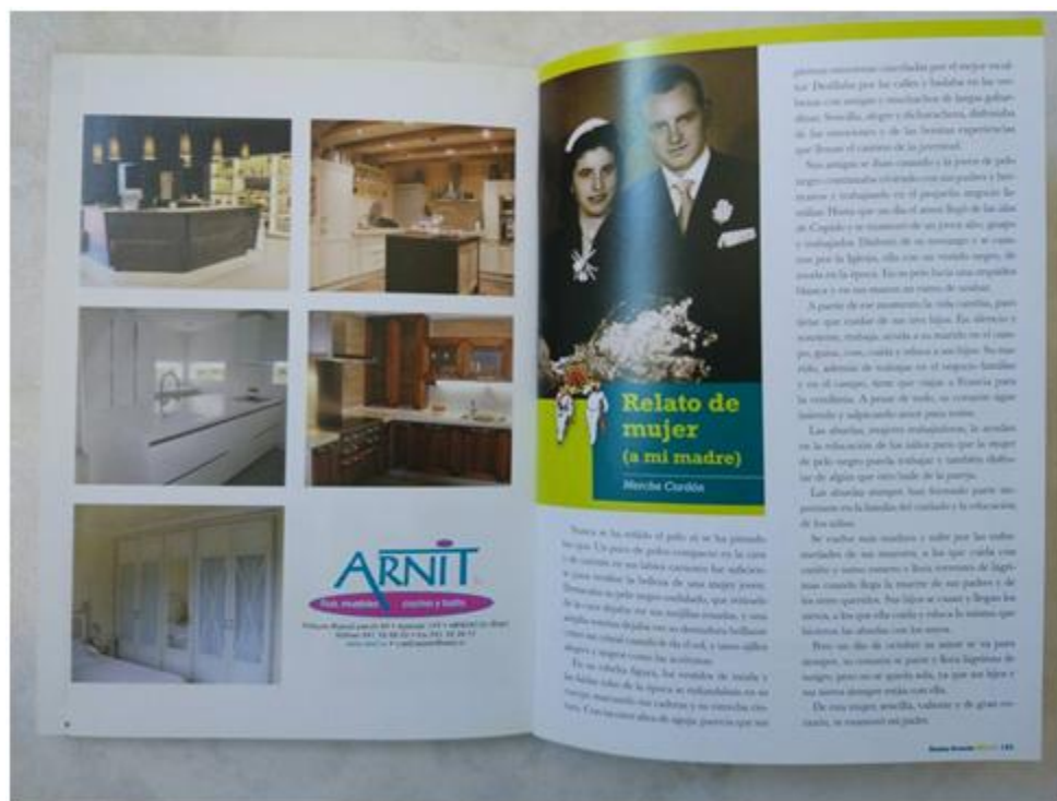
Figura 3.6 Anuncio en revista local