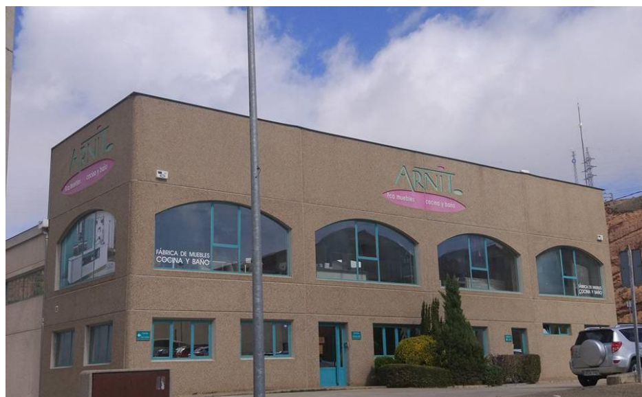
Figura 3.4 Logotipo sobre fachada del edificio