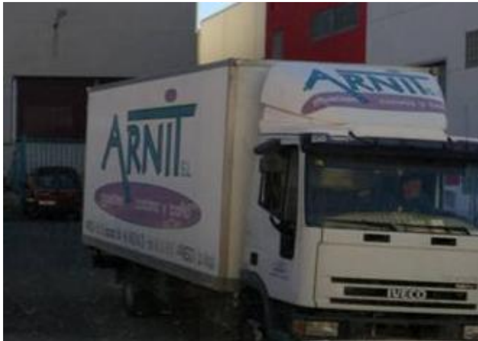
Figura 3.3 Vehículo corporativo Arnit

A continuación adjunto fotos del logotipo y de algunos ejemplos de aplicaciones del mismo en distintos soportes, y así poder mostrar y evidenciar lo mencionado anteriormente.