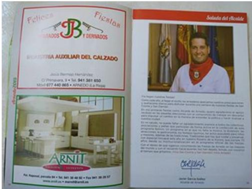
Figura 3.5 Anuncio en revista local