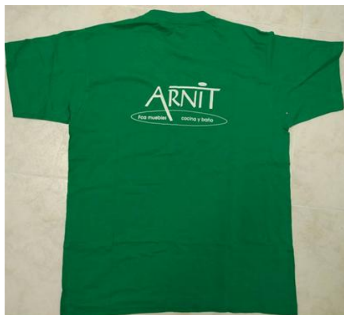
Figura 3.9 Uniforme corporativo. Camiseta