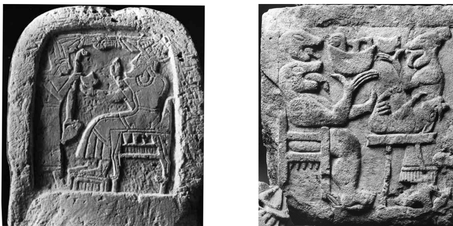
Fig. 2. Estela de Ras Shamra (Ugarit) con representación del dios El (izquierda); y relieve del “banquete” del monumento de Pozo Moro (derecha).

general que el asiento de Pozo Moro: reposabrazos, hueco entre este y el asiento, respaldo, ausencia de travesaños horizontales inferiores. Lo mismo sucede con alguno de los modelos que Steingraber engloba dentro del grupo “Throntyp 5a”. No obstante, el asiento representado en Pozo Moro replica un modelo que a finales del siglo VI a. C. es más característico del mundo griego que del ámbito itálico o etrusco, apareciendo sobre cerámicas y relieves laconios. Esto permitiría valorar un posible influjo del mobiliario heleno, sobre todo de la Magna Grecia, sobre la representación de Pozo Moro.