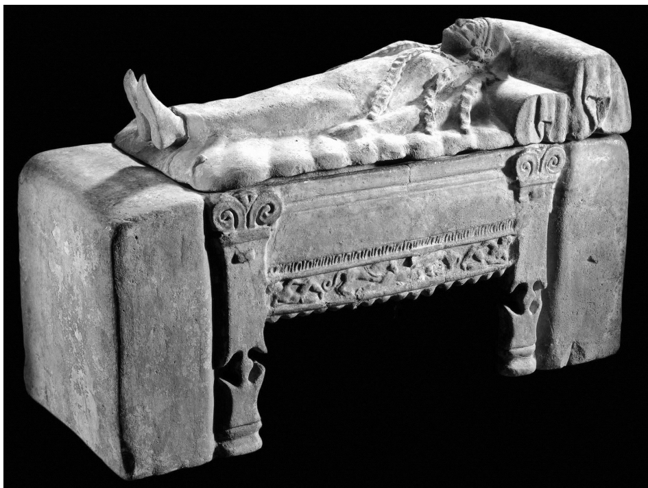
Fig. 4. Caere, 510-490 a. C.: Urna cineraria de terracota con representación de joven yacente sobre kline (Burn et alii, 1903: 179-180, B629 = British Museum, AN33261001).

Las patas de estas klinai muestran un rebajo lateral a media altura característico también del mobiliario griego (por ejemplo, aparece en la escultura con deidad entronizada de Tarento, datada en el segundo cuarto del siglo V a. C.); el cual está presente asimismo en la pata delantera del asiento de Pozo Moro (por desgracia, la rotura del relieve no permite precisar si existió otro, ligeramente más bajo, en la pata posterior). Este rebajo se ha considerado una mera fractura, de manera que se ha reconstruido el asiento como si estuviera compuesto de patas rectas (véase por ejemplo Ruano Ruiz, 1992: 29, n.º. 1). Pero su examen indica que lo más probable es que no sea una fractura, sino un detalle introducido por el escultor, pues se trata de un rebajo casi perfectamente cóncavo, con aristas rectas simétricas y en una zona en la cual no existe el menor signo de rotura, muy diferente por lo demás a los pequeños e irregulares desperfectos perceptibles en las patas de la mesa representada a su lado. Este tipo de rebajo cóncavo está presente en las patas de asientos y lechos de mobiliario etrusco (véanse en Steingraber, 1979, los ejemplos englobados en los “Klinentyp” 3a y 3b y entre los “Throntyp” 6).