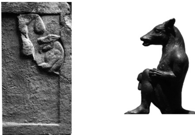
Fig. 1. Representaciones de personajes antropomorfos con cabeza de cánido (ca. 500 a. C.): bajorrelieve del extremo derecho del friso oriental del monumento turriforme de Pozo Moro (Almagro-Gorbea, 1983: taf. 24b) y estatuilla en bronce procedente de Caere (Gaultier y Haumesser, 2013: 194).

general antropomorfa. Su factura y estilo sitúan su producción en Etruria hacia 500 a. C. o un poco antes (Franken, 2007: 243; Gaultier y Haumesser, 2013: 194).