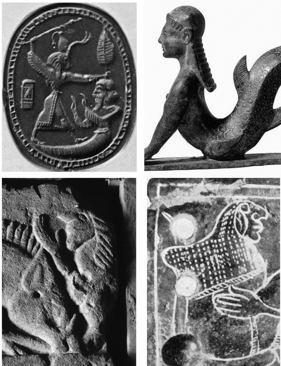
Fig. 7. De arriba abajo y de izquierda a derecha: Escarabeo MAI 3650, Puig des Molins, Ibiza, ca. 450 a. C. (Fernández y Padró, 1982: 133, n.º. 40); escultura en bronce etrusca de joven con extremidad inferior pisciforme (último tercio del siglo VI a. C.); detalle del relieve del “jabalí bifronte” del monumento de Pozo Moro; arte de las sítulas: placa de cinturón en bronce de la primera mitad del siglo V a. C. (Steingräber, 1979: taf. XIX, 1).