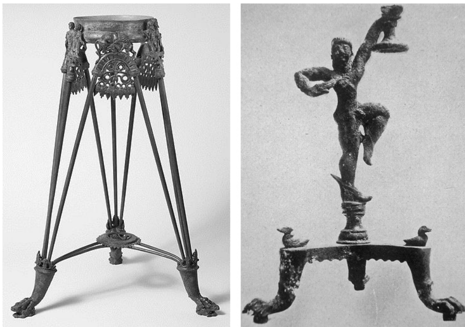
Fig. 3. Bronces vulcentes: trípode, ca. 525-500 a. C. (Metropolitan Museum of Art. Accession Number: 60.11.11 = De Puma, 2013: 74-75, n.º. 4.38); y timiaterio (Neugebauer, 1943: 273, abb. 50).

Una decoración similar a la del relieve de Pozo Moro aparece también en diversas urnas cinerarias de Caere realizadas en terracota, las cuales incluyen reproducciones de mobiliario. En este caso podemos distinguir dos tipos de representaciones. Un primer tipo (Fig. 4) lo conocemos a través de varias urnas conservadas en el Louvre (Briguet, 1968; Gaultier y Haumesser, 2013: 188) y de otra conservada en el British Museum (Burn et alii , 1903: 179-180). En ellas se representa a difuntos yacentes sobre klinai . A diferencia de los lechos que conocemos en el mundo heleno o a través de la pintura funeraria mural etrusca, estos muestran entre sus patas una decoración similar, compuesta por elementos que Briguet (1968: 58) define como “ovoides”, considerándolos una posible imitación de bordados festoneados. Pero la superposición de friso figurado en relieve sobre sucesión de elementos ovoides o triangulares se asemeja al formato que aparece sobre las producciones en bronce vulcentes. Por ello es posible que se trate de apliques bronceíneos en forma de guarniciones o tiras, similares a los de la urna de la Tumba del Duce de Vetulonia (véase Steingräber, 1979: 170-171), sin poder descartar tampoco que se trate de la representación de molduras realizadas en otros materiales, como madera o marfil.