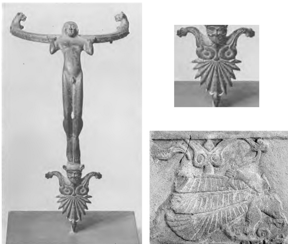
Fig. 6. Asa a kouroi de jarro de bronce de producción vulcente (Hill, 1958: pl. 53, fig. 16) con detalle de su palmeta; y relieve con “Árbol de la Vida” del friso occidental del monumento turriforme de Pozo Moro.

una pieza griega. Pero con posterioridad se ha identificado como de producción vulcente (Weber, 1983: 293, IDEtr.c.11; Graells, 2008b: 207; Bardelli y Graells, 2012: 34). Se conoce el fragmento de otro asa similar hallado en Cuenca (Graells, 2008b). Por desgracia, en ninguno de ambos casos se ha conservado ningún resto de la palmeta.