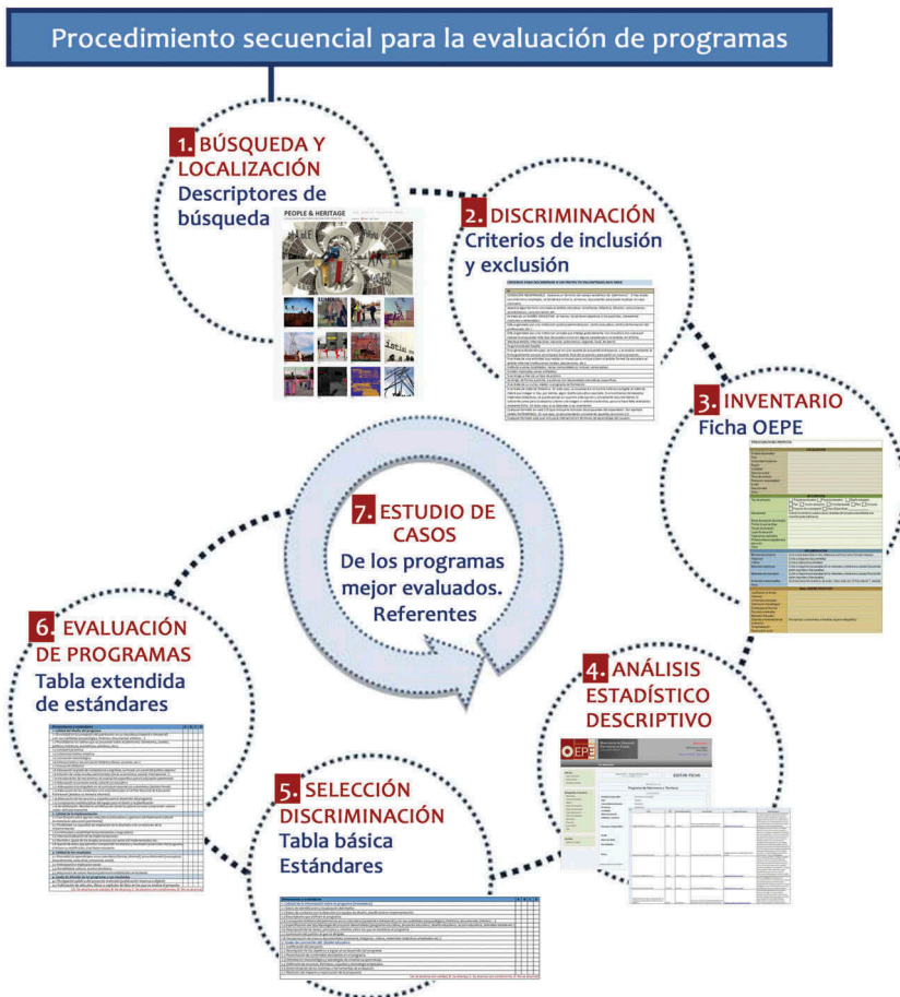
Figura 2. Procedimiento secuencial de selección de programas.

Empleamos un sistema de filtros secuenciado, que parte de la búsqueda y localización de programas conforme a una serie de indicadores de búsqueda definidos por el equipo de investigación y 12 expertos internacionales consultados. Sobre la relación de programas localizados (x), aplicamos una serie de criterios de inclusión y exclusión para su inventario en la base de datos, que aporta un universo de programas introducidos e inventariados (y), con los que efectuamos análisis estadístico-descriptivos, centrados en conocer las tipologías patrimoniales y educativas, la geolocalización de los programas, el grado de concreción del diseño, el tipo de implementación e instrumentos que emplean, etc. Posteriormente se seleccionan aquellos programas (z) que se aproximan a una serie de estándares generales vinculados al diseño, la implementación y los resultados. De entre ellos, los que mayor nivel de adecuación a estándares tienen ( z^+ ), son seleccionados para realizar una evaluación extendida, donde se incluye una evaluación específica relacionada con su tipología educativa (Stake, 2006). Los que destacan por su excelencia ( z^* ), son seleccionados para realizar un estudio de casos único o múltiple, según proceda (vid. Figura 2).