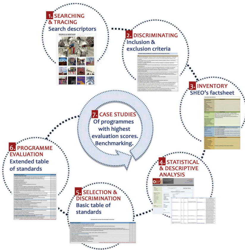
Figure 2. Sequential procedure for programme selection.

typologies, the programmes' georeferencing, the design's degree of specificity, the kind of implementation and the tools employed, etc. Later on, such programmes are singled out ( z ) as they get closer to the general standards involved in the design, the implementation and the outcomes. From that whole set of programmes, those that have a higher level of adequacy to the set standards are tagged as ( z^+ ) and selected for the purposes of an extended evaluation, including a specific assessment in terms of their educational typology (Stake, 2006). Those that stand out at attaining excellence ( z^* ) are further selected for the purpose of conducting a single or multiple case study, depending on which procedure appears to be the more appropriate (See Figure 2).