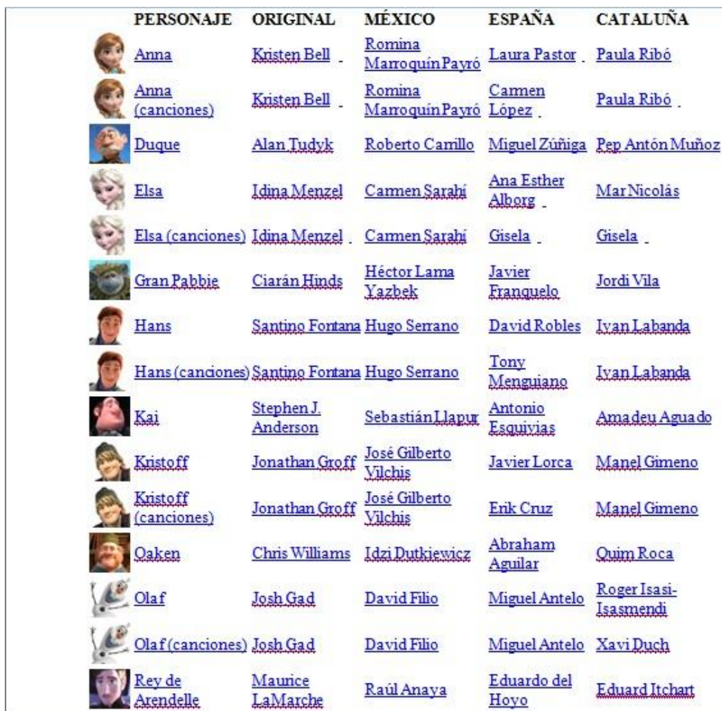
Figura 4. Personajes, sus voces en VO, en Latinoamérica, en España y en Cataluña. (doblajedisney.com)