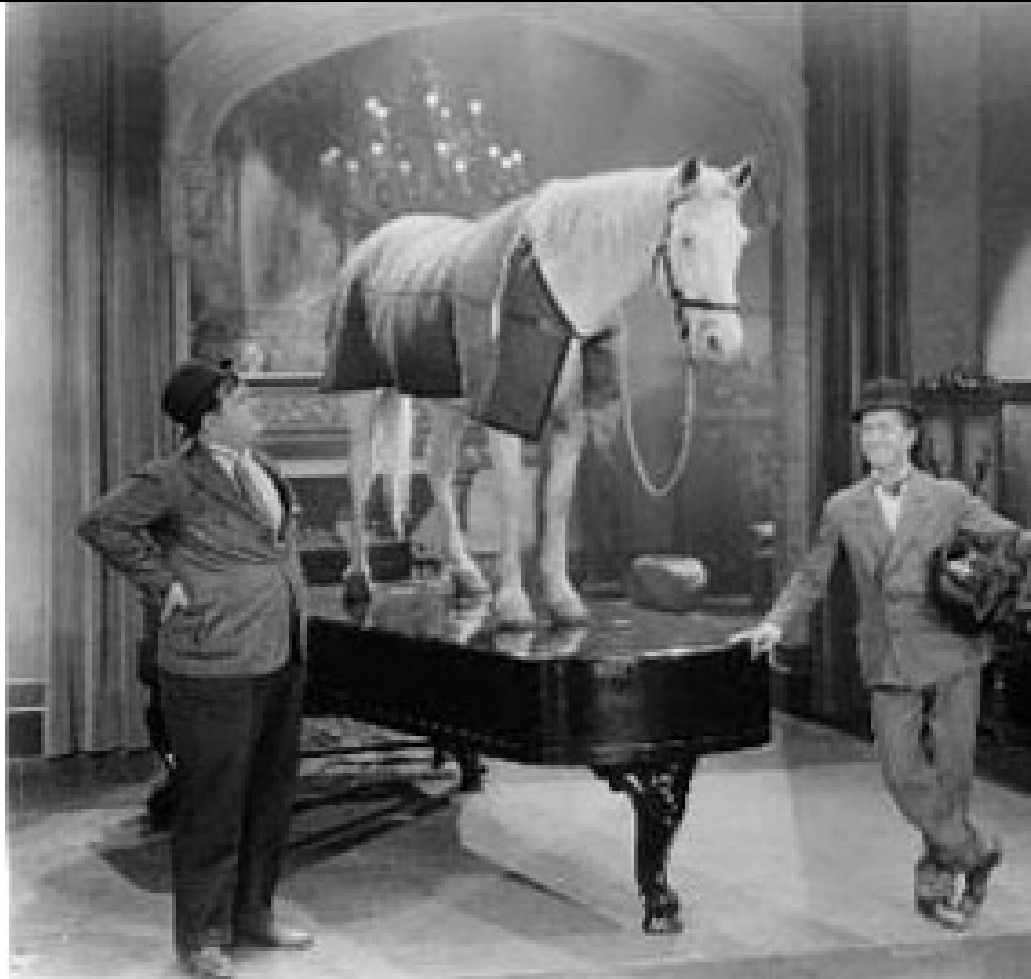
Laurel y Hardy