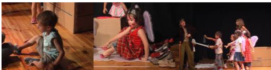
Niños de Primeras edades en la Escuela de Arte de Tyl Tyl 2009.

En las Primeras edades aparece la Necesidad de expresar, pero sin la conciencia de la espectacularidad, que aparece cuando niños reconocen el espacio ritual, como un espacio también de exhibición. Hacen sin necesidad de mostrar, pues no hay conciencia actoral y el tránsito del afuera-adentro y del adentro-afuera absorbe toda la energía. Lo que se hace, se transforma en objeto del sí mismo en la creación de destrezas y capacidades.