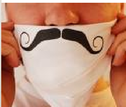
Danza del pañuelo (Perú)