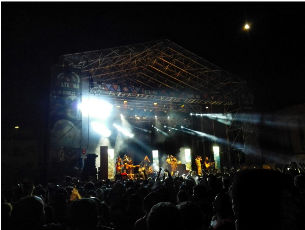
Figura 3.4. Escenario del Alterna Festival (2017). Alterna Festival. (2018). Facebook.com. Recuperado el 17 de mayo de 2018 17, de https://www.facebook.com/AlternaFestival/photos/a.215129391921524.35281.214833768617753/1151523074948813/?type=3&theater

Desde 2011-2012 hasta hoy día Berrintxe junto con Rolling Cyracus y el Ayuntamiento de El Bonillo han conseguido dotar al Alterna Festival de múltiples ventajas competitivas, ofreciendo actuaciones de grupos de éxito a nivel nacional e internacional, actividades, talleres y actuaciones circenses junto con una gran variedad de prácticas, charlas al aire libre a través del uso de los espacios municipales y acampada gratuita con sombra. Todo esto posibilita que este evento musical siga creciendo edición tras edición.