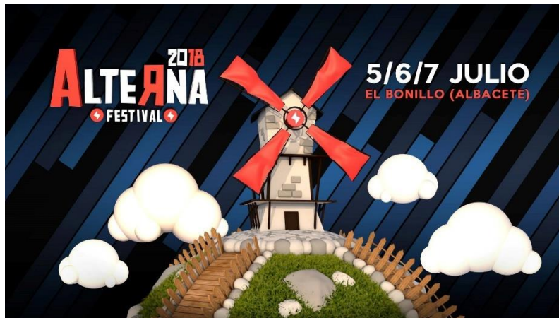
Figura 3.10. Anunciación de las fechas del Alterna Festival 2018. Alterna Festival. (2018). Facebook.com. Recuperado del 20 de mayo de 2018, de https://www.facebook.com/AlternaFestival/photos/pb.214833768617753.-2207520000.1526809820./1418831391551312/?type=3&theater

que dota de profesionalidad a este festival, que es capaz de adaptarse a todo tipo de medios estableciendo una comunicación unificada y fácilmente identificable como publicaciones del Festival.