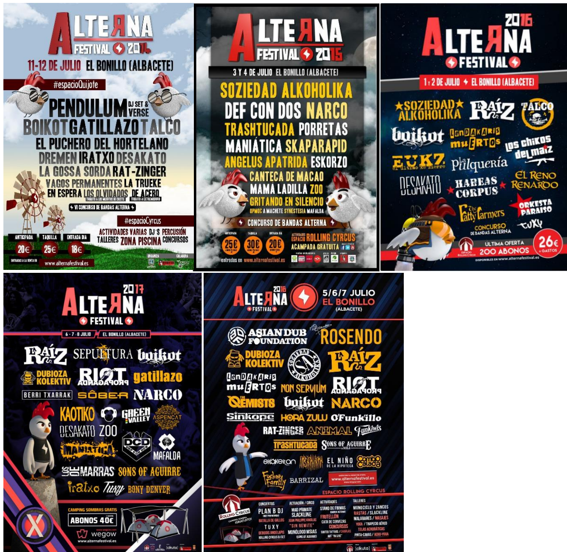
Figura 3.9. Cartelería Alterna Festival cedida por los promotores del festival.

Como puede apreciarse es a partir del 2012 cuando el Alterna Festival presenta su logo oficial y dos símbolos que lo diferencian: la gallina y el rayo. Además, también se puede apreciar como estos símbolos van evolucionando a lo largo de los años. Se puede comprobar que es a partir de 2016 cuando la identidad del Alterna Festival comienza a unificarse utilizando los mismos esquemas de color y en los carteles de 2017 y 2018 se utiliza el mismo estilo de gallina y de composición gráfica.