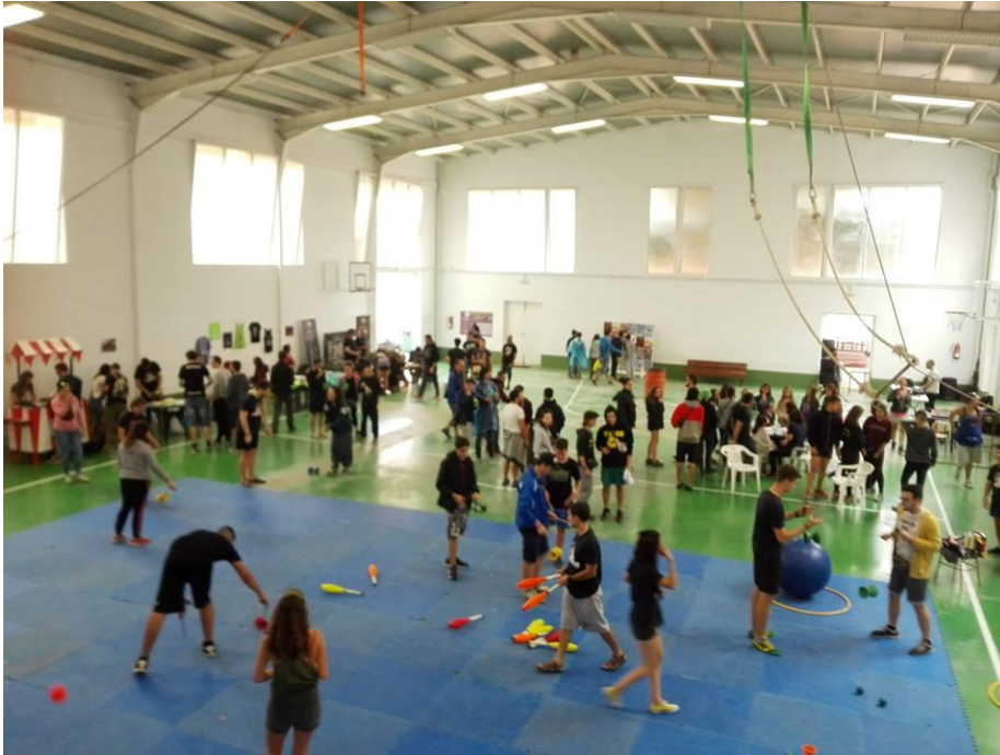
Figura 3.5. Espacio Rolling Cyrus (2017). Alterna Festival. (2018). Facebook.com. Recuperado el 17 de mayo de 2018, de https://www.facebook.com/AlternaFestival/photos/a.215129391921524.35281.214833768617753/1151075274993593/?type=3&theater