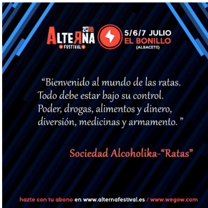
Figura 3.12. Contenido publicado (2018). Alternativa Festival. (2018). Facebook.com. Recuperado del 20 de mayo de 2018, de https://www.facebook.com/AlternativaFestival/photos/pb.214833768617753.-2207520000.1526809820./1417352765032508/?type=3&theater