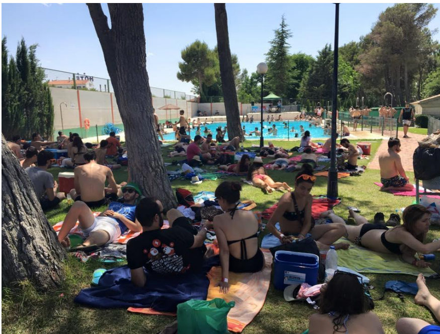
Figura 3.6. Piscina, Espacio Rolling Cyrus (2017). Alterna Festival. (2018). Facebook.com. Recuperado el 17 de mayo de 2018, de https://www.facebook.com/AlternaFestival/photos/a.215129391921524.35281.214833768617753/1416641841770267/?type=3&theater