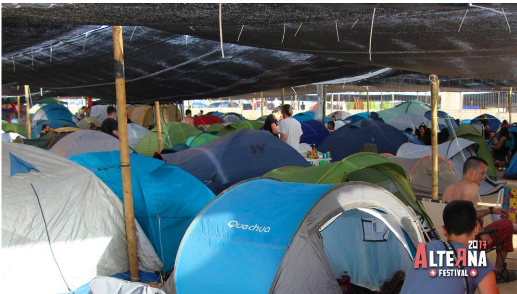
Figura 3.8. Zona de acampada (2017).