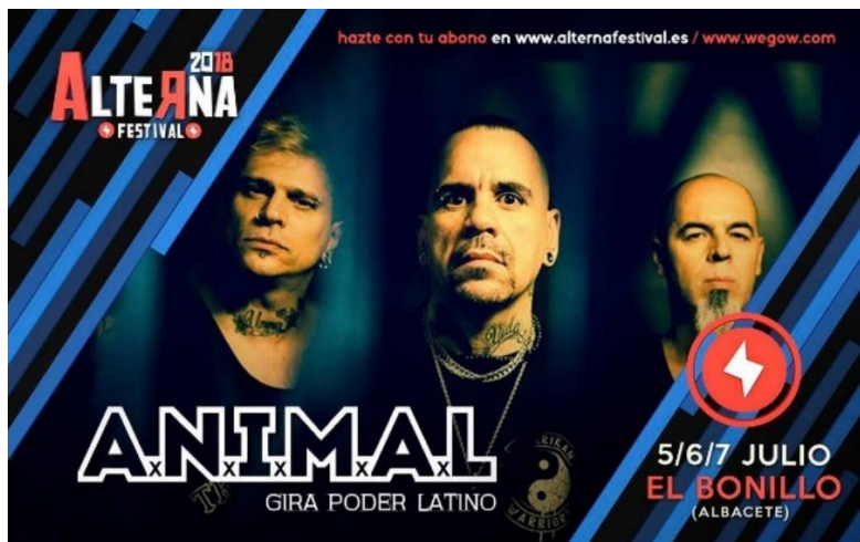
Figura 3.11. Confirmación de artistas (2018). Alterna Festival. (2018). Facebook.com. Recuperado del 20 de mayo de 2018, de https://www.facebook.com/AlternaFestival/photos/pb.214833768617753.-2207520000.1526809820./1418834801550971/?type=3&theater