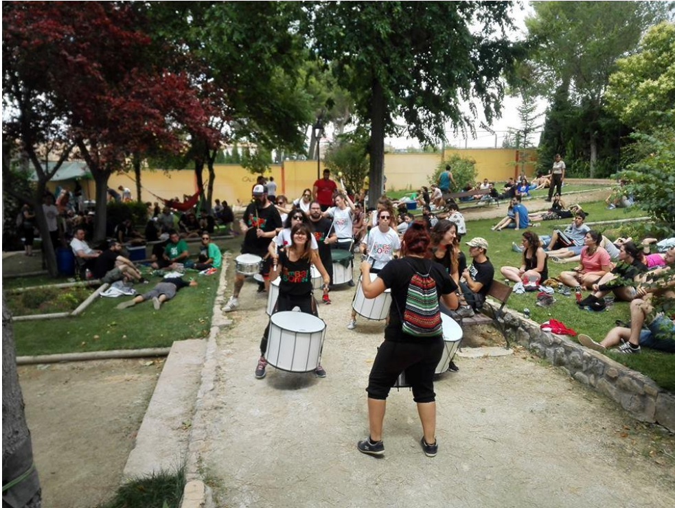
Figura 3.7. Batukada en el parque, espacio Rolling Circus (2017). Alterna Festival. (2018). Facebook.com. Recuperado el 17 mayo de 2018, de https://www.facebook.com/AlternaFestival/photos/a.215129391921524.35281.214833768617753/1152095631558224/?type=3&theater