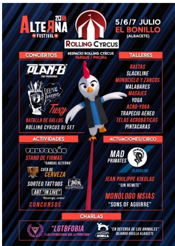
Figura 3.14. Cartel del espacio Rolling Circus 2018. Rolling Circus (2018). Alternafestival.es. Recuperado el 19 de mayo de 2018, de http://alternafestival.es/wp-content/uploads/RollingCircus.jpg