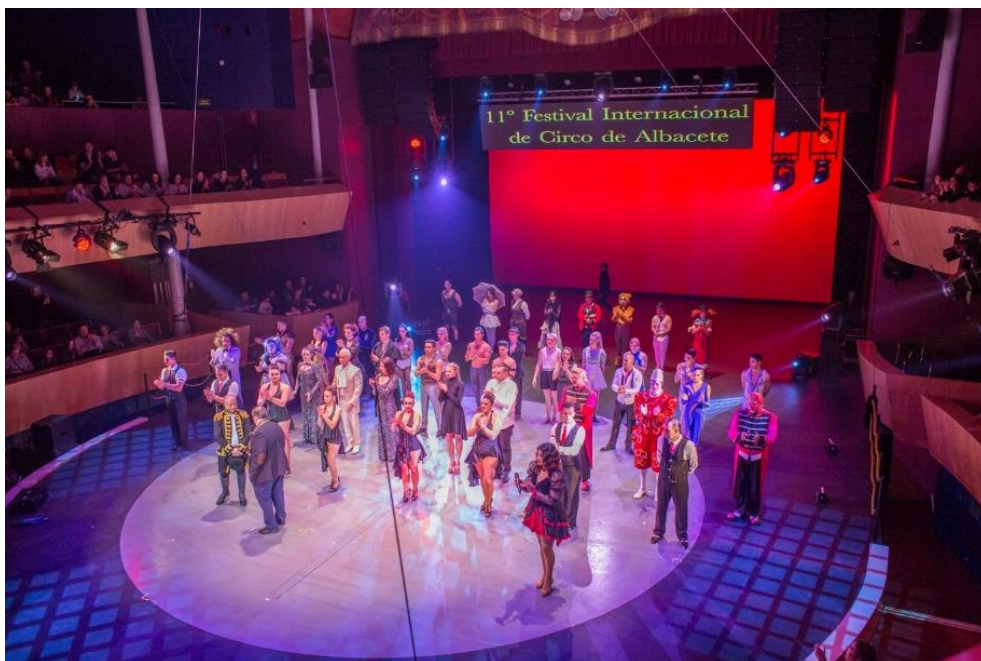
Figura 3.13. Rolling Cyrucus (primera fila) en el 11º Festival Internacional de Circo de Albacete (2018). Rolling Cyrucus. (2018). Facebook.com. Recuperado el 17 de mayo de 2018, de https://www.facebook.com/RollingCyrucus/photos/a.926759574164868.1073741850.174535526053947/926772944163531/?type=3&theater

en la noche de San Juan, talleres de malabares para niños en la Feria de Tradiciones y Artesanía Villa de El Bonillo y una escuela anual de circo para los más pequeños, entre otras múltiples actividades que llevan a cabo a lo largo del año. Además, son cofundadores y organizadores del espacio cultural (espacio Rolling Cyrucus) del festival de música Alterna Festival, que cada año cuenta con más afluencia de público. El espacio Rolling Cyrucus desarrolla una oferta cultural gratuita paralela a las actuaciones musicales del Alterna Festival en la que se puede disfrutar de múltiples actuaciones, talleres, concursos, sorteos, fiestas, baños en piscina, charlas y mercadillos.