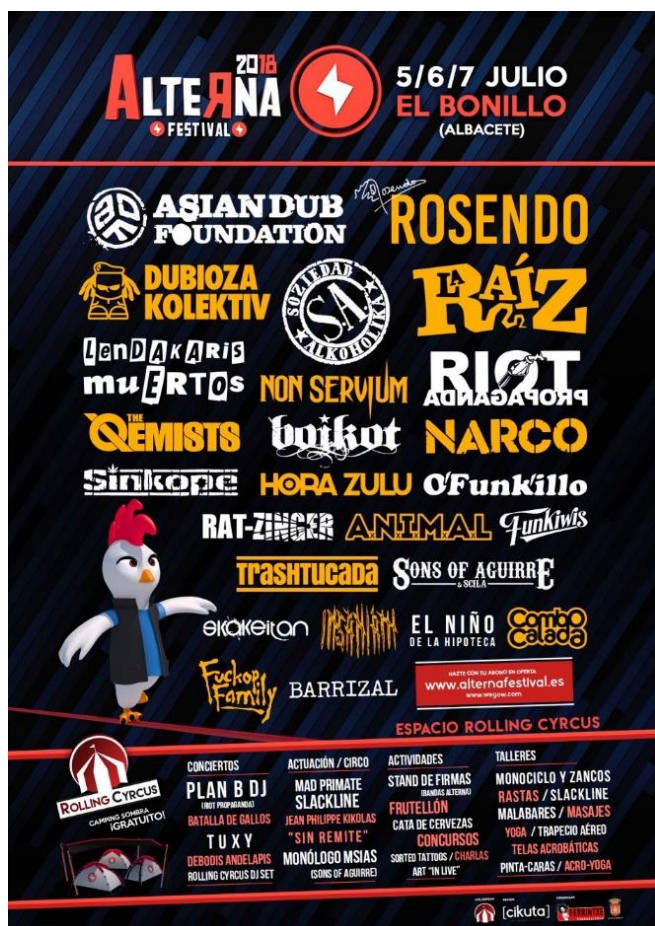
Figura 3.15. Cartel Alterna Festival 2018.

Berrintxe se caracteriza por trabajar en proyectos que aporten riqueza cultural y musical, además de contar con un equipo humano profesional y eficiente que también se caracterizan por desarrollar trabajos en comunicación de ámbito medioambiental y de conocimiento de otras culturas. Berrintxe Producciones comienza a trabajar con el Alterna Festival en 2012 para su 5º edición buscando profesionalizar el festival y aumentar la oferta del cartel musical con el fin de potenciar el crecimiento del Alterna Festival. De esta manera y hasta hoy en día Berrintxe producciones colabora junto a Rolling Circus y el Ayuntamiento de El Bonillo para mejorar la calidad del festival y por tanto conseguir hacer de este un evento cada vez más atractivo para el público español.