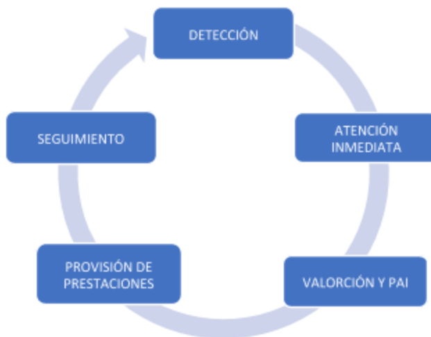
Figura nº2: gráfica de proceso de intervención social en mujeres VVG