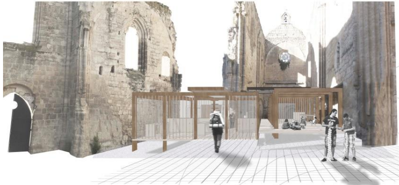
Figura 7 - Tallado del suelo.

En general se plantearon soluciones que buscaban producir al visitante una experiencia , hay que reconocer que las ruinas del monasterio eran bastante propicias; así los elementos que formaban parte del proyecto permitían apreciar la atmósfera mágica de aquel lugar, sentir el paso del tiempo, la solidez de su forma truncada, el frío y la sombra de sus muros históricos, entre otras sensaciones [Fig. 8]. La disposición de las piezas del proyecto enlazadas con los recorridos más idóneos, los que proporcionaban mejores lugares para la observación, junto con la adecuada elección de materiales, buscaban que el visitante descubriera la mejor percepción multisensorial, y el mejor conocimiento del lugar.