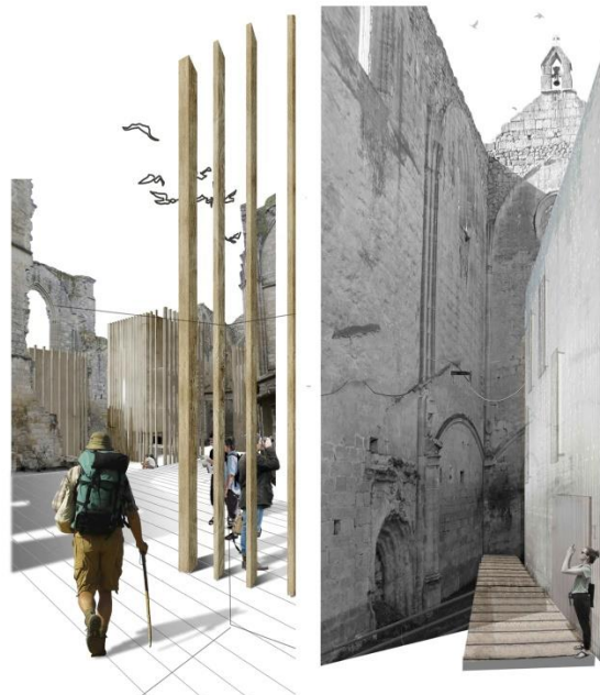
Figura 8 - Las experiencias del recorrido.

En general se plantearon soluciones que buscaban producir al visitante una experiencia , hay que reconocer que las ruinas del monasterio eran bastante propicias; así los elementos que formaban parte del proyecto permitían apreciar la atmósfera mágica de aquel lugar, sentir el paso del tiempo, la solidez de su forma truncada, el frío y la sombra de sus muros históricos, entre otras sensaciones [Fig. 8]. La disposición de las piezas del proyecto enlazadas con los recorridos más idóneos, los que proporcionaban mejores lugares para la observación, junto con la adecuada elección de materiales, buscaban que el visitante descubriera la mejor percepción multisensorial, y el mejor conocimiento del lugar.