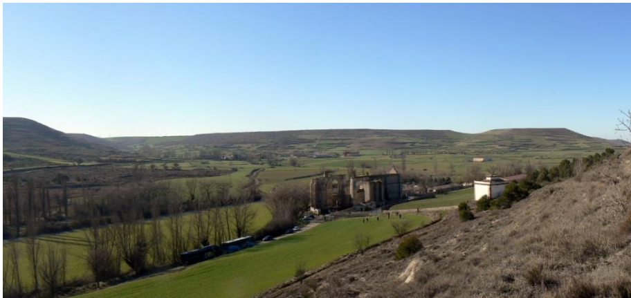
Figura 2 - Ruinas de San Antón en el paisaje.

Profundizar en estos conceptos requiere de un proceso de interiorización que tiene que realizarse desde el aprendizaje. En la enseñanza de Arquitectura, habitualmente, estas cuestiones son tratadas como temas colaterales, quizás porque siempre se han tenido como materias auxiliares; sin embargo si se consideran como auténtica sustancia proyectual probablemente se consiga un mayor compromiso de los futuros profesionales.