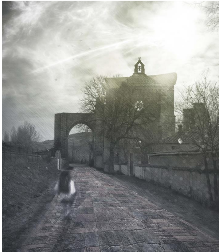
Figura 5 - Intervención sobre el propio camino.

El trabajo fue dificultoso por la diferencia de nivel que existe entre el camino y el interior de la iglesia, así como por la imposibilidad de conocer la potencia del terreno, pues sería necesaria una excavación arqueológica. Muchos propusieron recorridos elevados, sistemas palafíticos, de alguna manera abstrayéndose de lo que ocurría en el suelo [Fig. 6], otros se pusieron en contacto con él y abordaron directamente el problema del terreno, su orografía y los restos que allí se encontraban. Y aún hubo algunos más que trabajaron con el suelo, buscando sus potencialidades, tallando allí donde era necesario, construyendo donde se requería [Fig. 7].