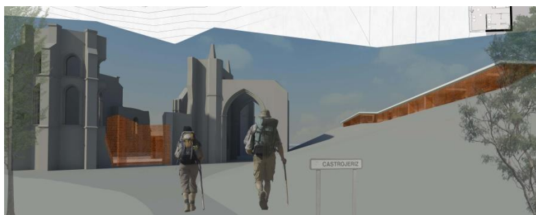
Figura 4 - El monumento y una intervención.

Para definir el carácter del proyecto debía de considerarse que el albergue es una dotación peculiar, pues solo se prevé para proporcionar descanso, aseo y residencia temporal únicamente durante una noche. Para los otros visitantes, los que quieran conocer el monumento, se organiza un sistema de recepción e información sobre el monasterio y la posibilidad de visitar sus ruinas. Evidentemente ambos aspectos formaban parte de la misma actuación y debían resolverse con los mismos criterios proyectuales.