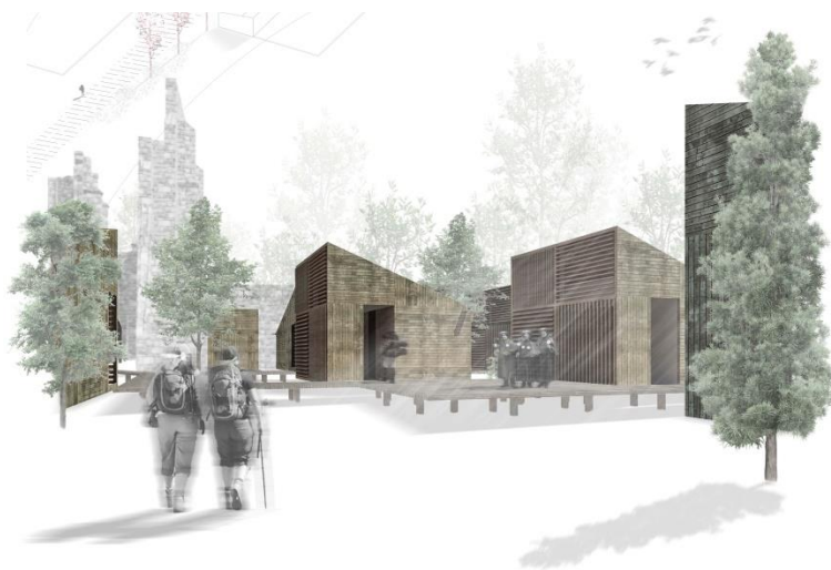
Figura 6 - Propuesta palafítica.

El trabajo fue dificultoso por la diferencia de nivel que existe entre el camino y el interior de la iglesia, así como por la imposibilidad de conocer la potencia del terreno, pues sería necesaria una excavación arqueológica. Muchos propusieron recorridos elevados, sistemas palafíticos, de alguna manera abstrayéndose de lo que ocurría en el suelo [Fig. 6], otros se pusieron en contacto con él y abordaron directamente el problema del terreno, su orografía y los restos que allí se encontraban. Y aún hubo algunos más que trabajaron con el suelo, buscando sus potencialidades, tallando allí donde era necesario, construyendo donde se requería [Fig. 7].