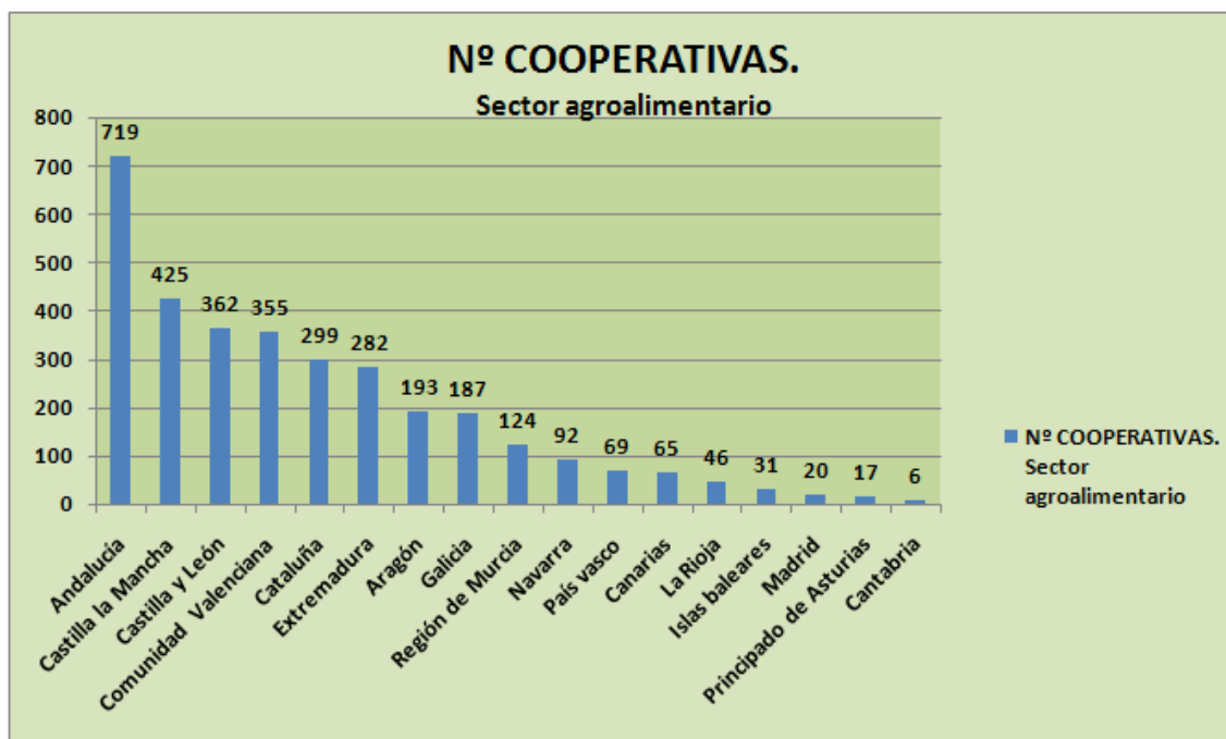
Gráfico 2: Nº cooperativas por comunidad autónoma en 2015.

Fuente: Elaboración propia a partir de datos obtenidos en OSCAE (2017) 32