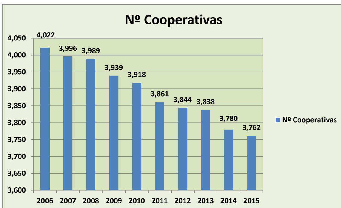
Gráfico 1: Número de cooperativas en España (2006-2015)

Fuente: Elaboración propia a partir de datos obtenidos en OSCAE (2017) 31