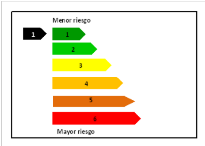
Ilustración 1. Forma que representa el indicador de riesgo

La figura anterior puede ser sustituida por la representación gráfica a través de la indicación numérica de la clase a la que pertenece el producto financiero en la parte del numerador permaneciendo el denominador siempre constante en el número 6. La orden ministerial establece los colores que deben utilizarse en el apartado 4 del anexo y que a continuación mostramos en la ilustración 2: