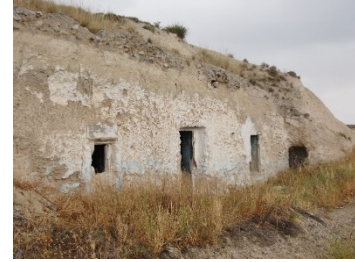
Casas cueva o Silos en la actualidad, Cabeza del Tomillar (El Romeral).