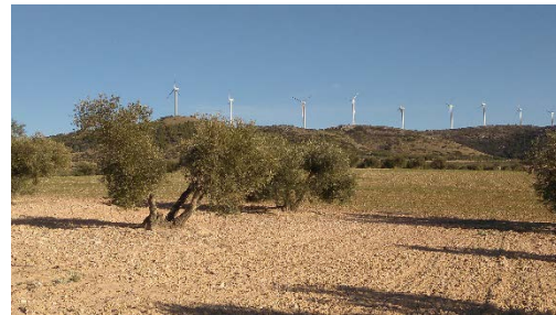
Parque eólico y molinos de viento: El Pechuga, El Crítica, Los Gorrinos y El Muela.