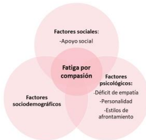
Figura 1. Factores que influyen en la fatiga por compasión.

Dicho término es un concepto desarrollado a finales del siglo XX e introducido en el área de la salud en 1995 por Charles Figley, director del Traumatology Institute at Tulane University (New Orleans) (15). Los individuos que experimentan fatiga por compasión refieren una sensación de cansancio que provoca una disminución generalizada del deseo, habilidad o energía para ayudar a otros individuos(15).