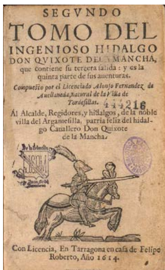
'Segundo tomo del Ingenioso hidalgo don Quixote de la Mancha' (El Quijote de Avellaneda), impreso en Tarragona en 1614. BNE - Biblioteca Digital Hispánica

edición impresa en Bruselas por Roger Velpius en 1608. BNE - Biblioteca Digital Hispánica