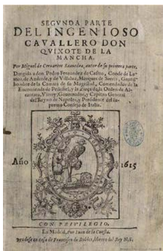
Segunda parte del ingenioso caballero don Quixote de la Mancha, por Miguel de Cervantes Saavedra. Impreso por Juan de la Cuesta en 1615.

imitó burlescamente los episodios del Quijote apócrifo. Avellaneda había convertido a don Quijote en un fantoche y a Sancho Panza en un simple, y Cervantes corrigió esas características.