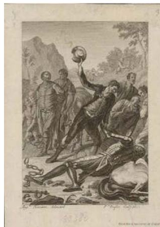
Ginés de Pasamonte golpea a Don Quijote con la bacia. Grabado de Pierre Duflos y Agustín Navarro, 1797.

Como hemos dicho, para replicar a Avellaneda, Cervantes empezó a escribir a toda prisa la verdadera segunda parte del Quijote . En ella