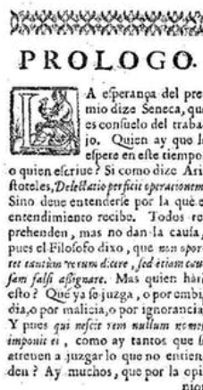
© Biblioteca Nacional de España Primera de las cuatro páginas del prólogo a 'El peregrino en su patria', de Lope de Vega en

Lope argumenta que sus comedias se ajustan al gusto de los españoles, y presume de haber compuesto muchísimas. Y tacha al autor de las críticas de poco productivo y envidioso.