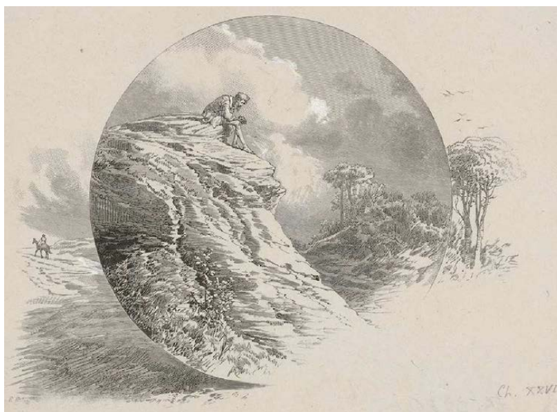
Penitencia de Don Quijote (Ricardo Balaca o Joseph-Luis Pellicer, 1880).

Además, Cervantes se burló del comportamiento de Anfriso, el protagonista de La Arcadia , en un episodio en el que don Quijote hace penitencia en Sierra Morena. Y como Anfriso representaba a su autor, Cervantes satirizó a Lope .