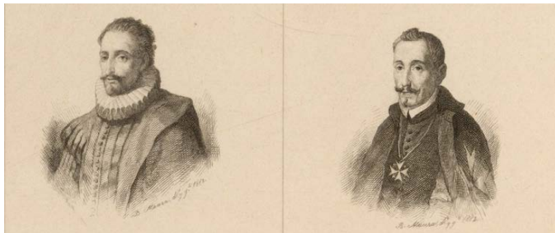
Cervantes y Lope en un aguafuerte de Bartolomé Maura Montaner de 1882. BNE - Biblioteca Digital Hispánica

A los 33 años, después de ser liberado, regresó a España, y escribió algunas comedias teatrales que fueron representadas. Y en 1585 publicó La Galatea , una novela pastoril. Sin embargo, no tuvo demasiado éxito con la literatura, y buscó otras formas de ganarse la vida.