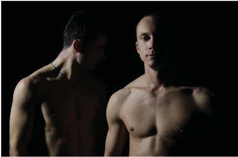
Dos jóvenes desnudos