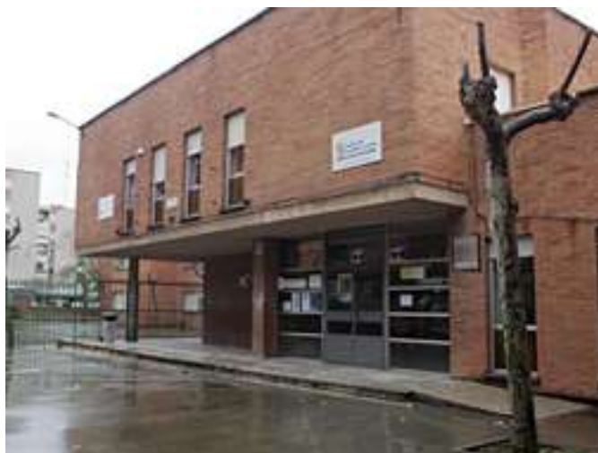
Imagen 5-1 CEIP Antonio Allúe Morer, Valladolid

“El colegio es una burbuja. Se les llama 2030, antigua tipología de colegios de difícil desempeño. Tienen un contra añadido, el alumnado. El 70% son minorías étnicas y, a priori, puede haber casos problemáticos. Pero, comparado con otros colegios de la misma tipología, estamos por debajo en incidentes, con datos equiparables a colegios públicos o concertados” (E6, p.1).