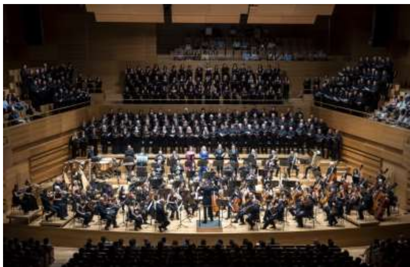
Imagen 5-3 La OSCyL en el Concierto de clausura de la temporada 2018/19

Como profesorado de las especialidades instrumentales y coro participan en la ciudad de Valladolid unas veintidós personas: catorce en el Allúe Morer, siete en el Arca Real y una en el Cristóbal Colón. Se trata tanto de instrumentistas de la plantilla de la OSCyL como de profesionales que tienen algún tipo de vínculo con la misma, aunque no formen parte de ella.