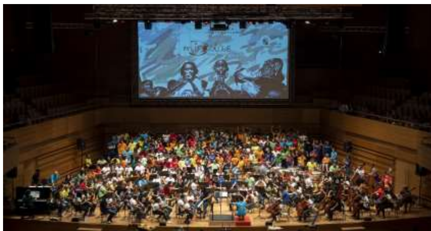
Imagen 5-6 Vista del CCMD en el Concierto final Miradas 2018/19