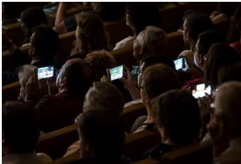
Imagen 5-7 Asistentes al Concierto final Miradas 2018/19

parecen estar de acuerdo: “para mi es una cuestión muy importante, necesitamos a un profesional que las lleve y lo he solicitado” (E1, p.7).