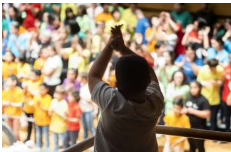
Imagen 5-5 Escena del Concierto final Miradas 2018/19