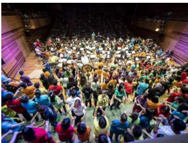
Imagen 5-4 Participantes en el Concierto final Miradas 2018/19

En la actualidad, el proyecto se centra en alumnado de educación primaria del Allúe Morer de Valladolid, si bien es cierto que también se realizan actividades con los alumnos del Arca Real y Cristóbal Colón, como señalábamos. Además, en el presente curso se ha procedido a realizar una ampliación del proyecto a diferentes ciudades de la provincia, creando coros en diversos colegios de la comunidad, como veremos posteriormente. En un futuro, la intención es que esos coros se conviertan también en orquestas.