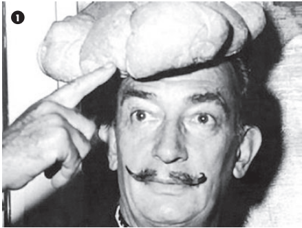
1. Salvador Dalí con un pan en la cabeza (1958).

Aprendió de los surrealistas, entre otras cosas, el poder del impacto por tergiversación: la fuerza del objet trouvé insertado en contextos inverosímiles, mecanismo inventado por el Dadá pero que ellos habían perfeccionado tiñéndolo de irracionalidad y de erotismo onírico. Efectivamente, los surrealistas recurrieron al extrañamiento producido por el objeto encontrado de los sueños: frente a la presunta lógica de la fenomenología de la vigilia, el universo onírico ponía en duda todos los aspectos racionales que gobernaban la vida despierta. El hombre se acostumbró cada noche a encontrarse elementos absurdos, fuera de contexto, cambiados de escala y carentes de sentido que aparecían al soñar (FIGURA 1). El psicoanálisis había demostrado que esa descolocación del objeto no era gratuita y que tenía una razón oculta, que el análisis clínico podía desvelar y que se encontraba ligada ineludiblemente a las más primitivas pulsiones humanas.