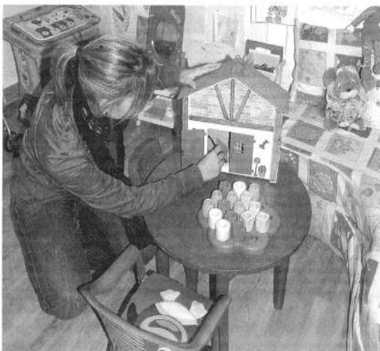
El punto de encuentro de Aprome en Valladolid pretende ser lo más parecido a un hogar.

Juzgados de instrucción y primera instancia, servicios de atención a la mujer y de protección a la infancia, casas de acogida, abogados o incluso ayuntamientos y Diputación derivan el mayor porcentaje de casos, además de otro 5% que acude por acuerdo de la propia pareja.