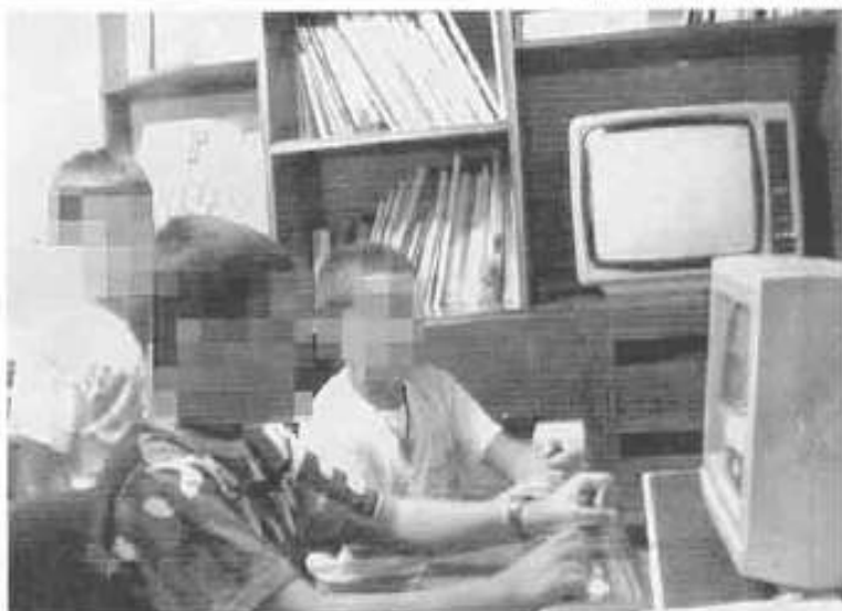
Sala de estar de un punto de encuentro familiar en la región.

Aprome puede estar hasta dos años prestando atención a una pareja y sus hijos, tiempo que puede tardar en completarse un proceso de separación y en contar esa familia deshecha con un régimen de visitas estipulado por un juez. «Una vez que hay sentencia deben hacerse a la idea de que hay que aceptar, adaptarse y valerse por ellos mismos», explica la presidenta de Aprome, al margen de la mediación de los puntos de encuentro familiar.