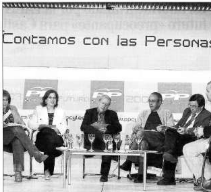
Los participantes en la mesa redonda organizada durante el Foro de Familia e Igualdad de Oportunidades.

Incidió en la necesidad de trabajar para resolver los principales problemas de los jóvenes: la vivienda, el empleo y la educación.