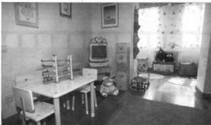
El punto de encuentro de la calle Perú cuenta con habitaciones decoradas y llenas de juguetes y peluches. J. M. COSTA

El primer centro de punto de encuentro familiar de toda España se abrió en Valladolid hace 12 años. Desde entonces casi 2.000 menores han utilizado este servicio en la provincia, en las dos sedes de la capital —en las calles Dox de Mayo y Perú— y en la de Medina del Campo. Los menores que han empleado este espacio neutral de mediación familiar ascienden a 1.966 y corresponden a 1.267 familias, desde que el primer centro pionero