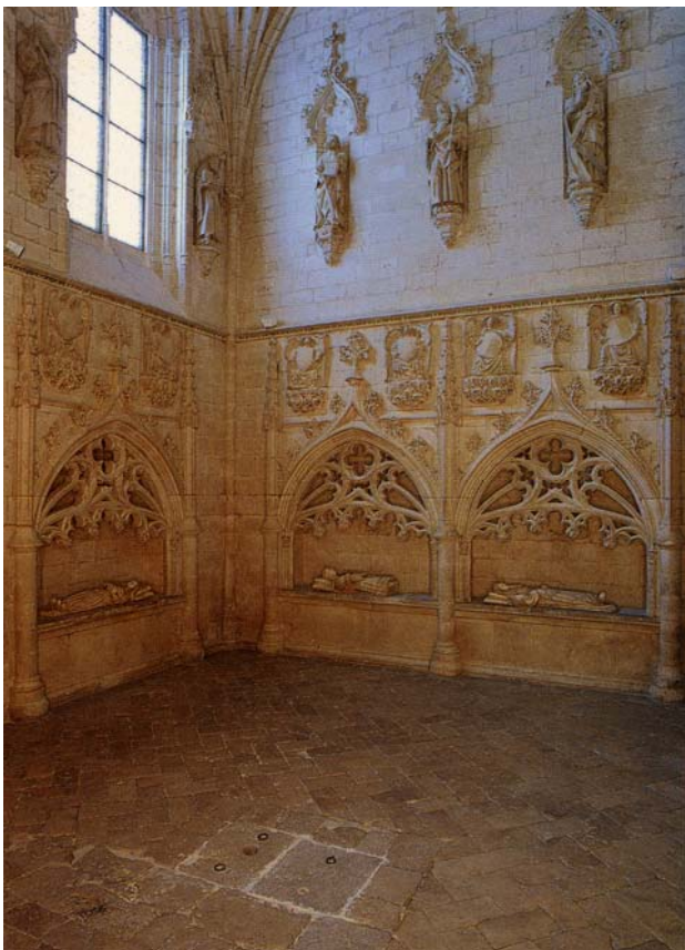
(Imagen 2. Capilla de los Saldaña. Monasterio de Santa Clara. Tordesillas)