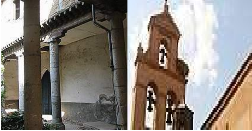
(Imagen 1. Ruinas del Hospital Mater Dei de Tordesillas)