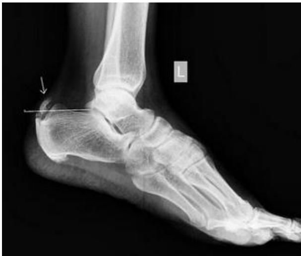
FIGURA 3: imagen radiológica de la deformidad de Haglund

Las bursas o la entesis pueden ser susceptibles de inflamación en los casos en los que el calzado sea duro y demasiado ajustado en la zona posterior del talón, en caso de existir una deformidad de Haglund, una tendinitis Aquilea insercional o por una artiritis reumatoide (Ahmed et al. 2012), (Thomas et al. 2010), (Tu y Bytomski, 2011) y (Aldriadge, 2004).