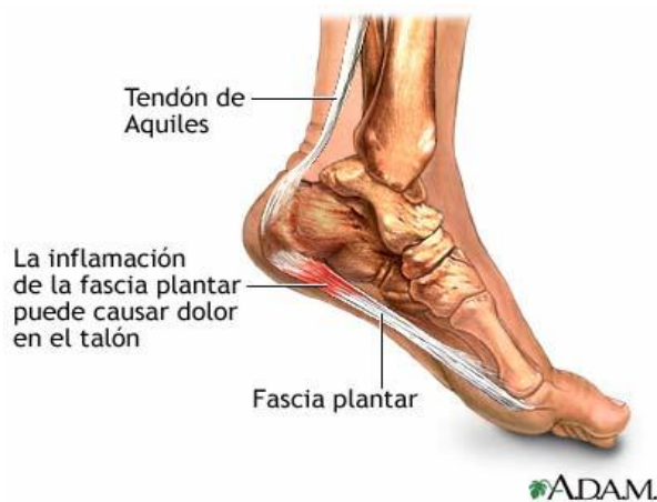
FIGURA 1: visión medial del pie, su fascia y el tendón de Aquiles.

Los principales síntomas son dolor e inflamación en la zona de inserción de la fascia en el calcáneo (Figura 1) e imposibilidad para caminar, sobre todo con los primeros pasos por la mañana o tras un periodo de reposo (Aldriadge, 2004), (Muñoz et al. 2010). Tu y Bytomski (2011), Cole et al. (2005), Cutts et al. (2012) y Tae Im Yi (2011) describen que el dolor disminuye a medida que el paciente camina pero aumenta con la bipedestación prolongada, al subir escaleras, andando descalzo y con la dorsiflexión de los dedos del pie.