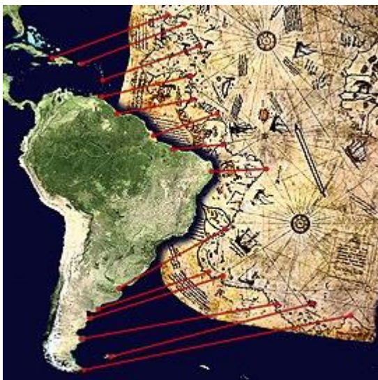
Ilustración 1 Mapa Pri Reis

Complementando a estos textos se proyectarán en imágenes en la pizarra digital de la clase un conjunto de mapas y cartografía original de la época, para que comprendan la visión espacial del mundo que se tenía en la época y lo innovador del proyecto colombino.