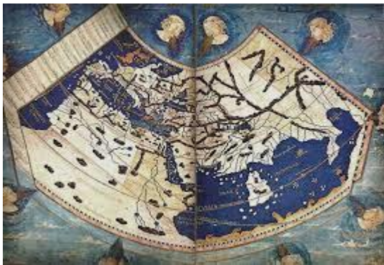
Ilustración 3 Ptolemaico