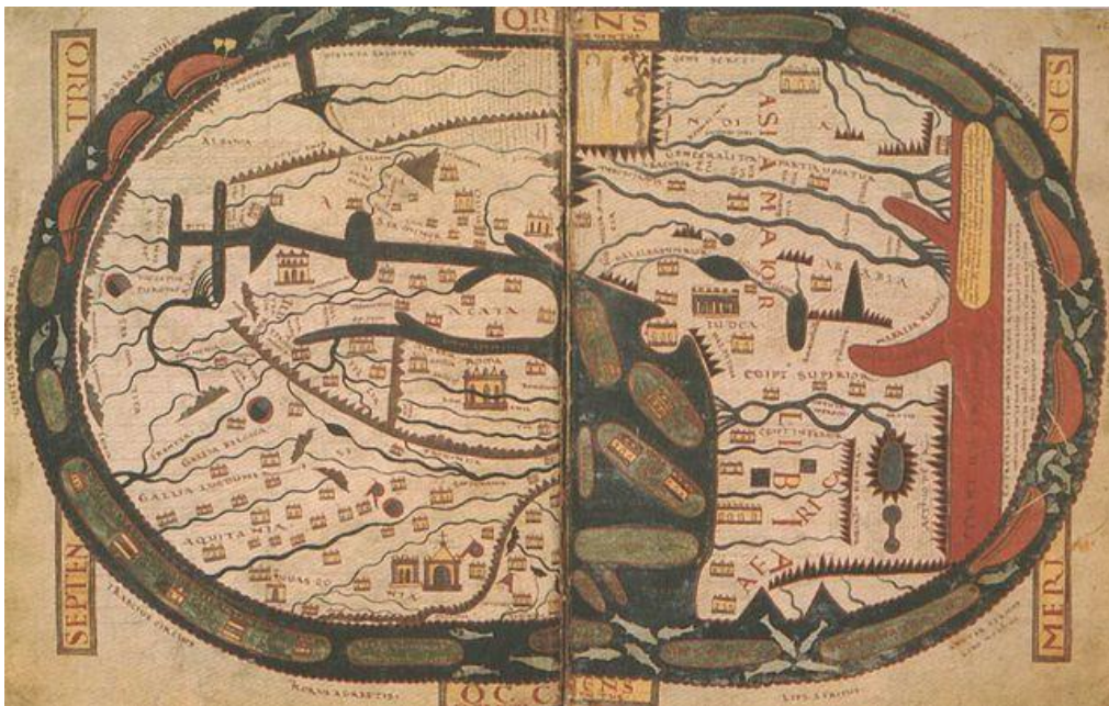
Ilustración 4 Beato de Liébana