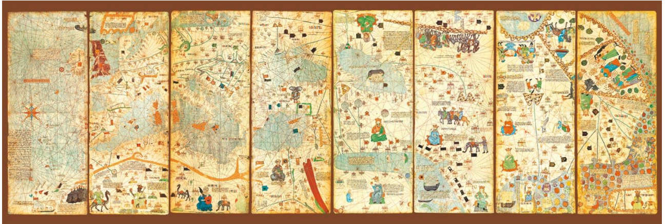
Ilustración 2 Atlas Cresques